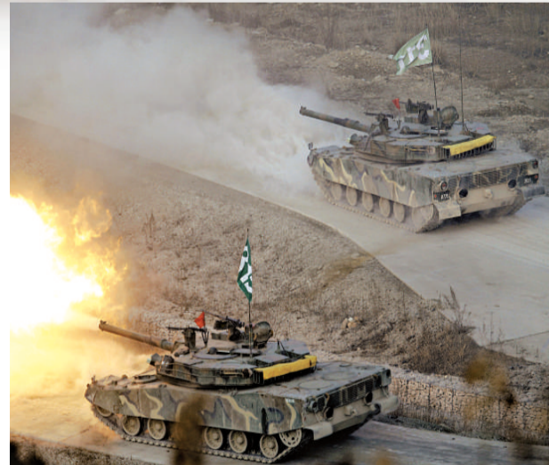
▲韓國K-1坦克在陸空聯合演習中發射實彈 資料圖片

韓國軍方曾想模仿台灣金門島的地下要塞，但因需要投入龐大資金，目前還在慎重考慮。軍方負責人說，若要在2015年前建成要塞，就不能修建類似金門島的全島要塞，而是針對局部挑戰，在島上部分區域建設要塞。