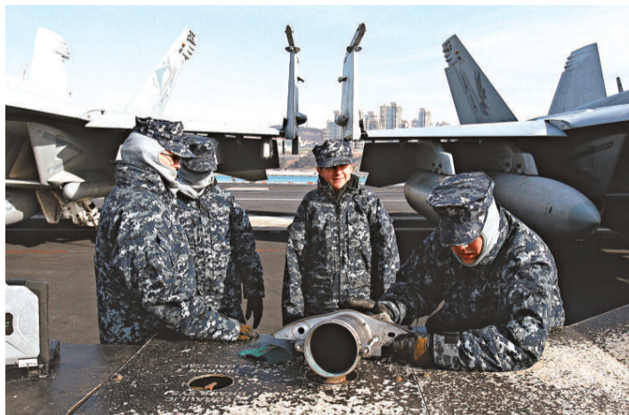
▶美軍士兵11日在抵達韓國釜山基地的美國「卡爾·文森」號航母上工作 資料圖片

據朝鮮媒體報導，美國海軍「卡爾·文森」號核動力航母9日至10日在日本長崎縣附近海域，與日本海上自衛隊舉行聯合演習後，於11日抵達韓國釜山。該艦正與韓國舉行聯合軍事演習。