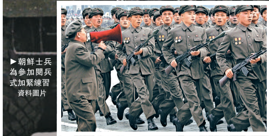
▶朝鮮士兵為參加閱兵式加緊練習