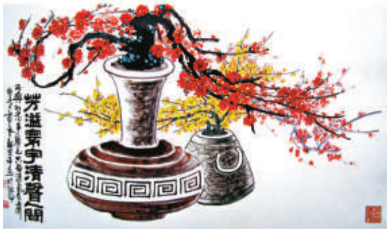
▲芳溢寰宇清香人間 (中國畫)