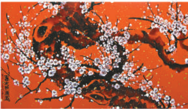
▲春光照通遐 (中國畫)