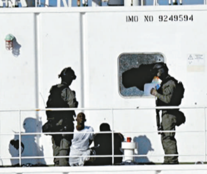
▶突襲過後，索馬里海盜被韓國海軍生擒

【本報訊】據中新社、新華社、韓聯社首爾二十一日消息：韓國海軍 21 日對索馬里海盜發動突襲，成功解救了本月 15 日在印度洋海域被索馬里海盜劫持的「三湖珠寶」韓國貨船，船上 21 人全部獲救。8 名海盜在營救過程中被打死。