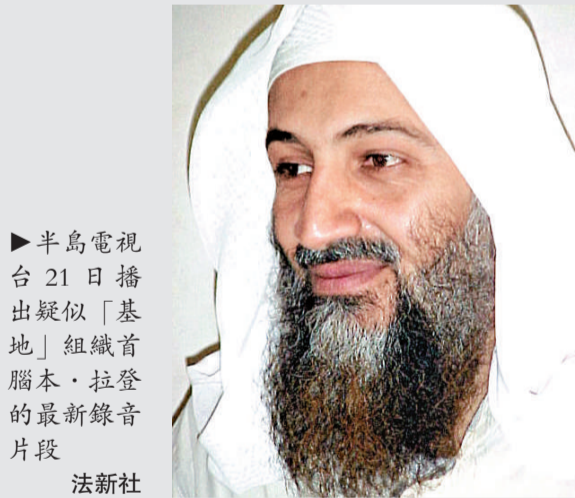
▶半島電視台 21 日播出疑似「基地」組織首腦本·拉登的最新錄音片段 法新社

【本報訊】據法新社迪拜二十一日消息：卡塔爾半島電視台 21 日播出一份錄音帶，相信是「基地」組織首腦本·拉登的最新錄音片段。