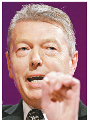
▲英國工黨影子財相莊漢生 19 日突然宣布辭職

反對黨工黨目前在民調中領先。不過評論認為，工黨要重新掌權還有很長的路要走。特別是上屆工黨政府內赤字膨脹，工黨亟需恢復在管理經濟方面的信譽。