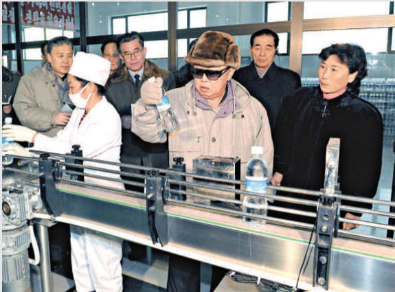
▲朝中社 20 日刊登朝鮮領導人金正日（中）視察平壤一間工廠的照片

【本報訊】據韓聯社、朝中社二十一日報導：韓國統一部 21 日表示，朝鮮應在韓朝高級軍事會談上就「天安」艦事件和延坪島事件進行道歉。朝鮮方面則強調平壤有決心解決所有軍事問題。