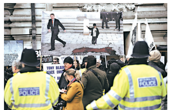
▲反戰人士 21 日在聆訊會場外舉行示威

許多反戰人士 21 日一早便集結在聆訊會場外示威。「停戰」組織負責人克里斯說：「貝理雅在開戰合法性問題上對公眾說謊。他沒有更多理由去逃避公正，更不應該繼續作為聯合國的中東特使。」