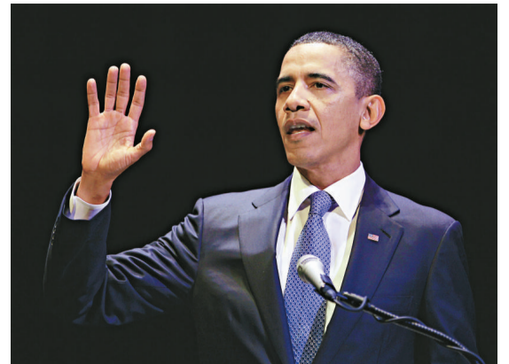
▲總統奧巴馬很可能參加 2012 年總統競選