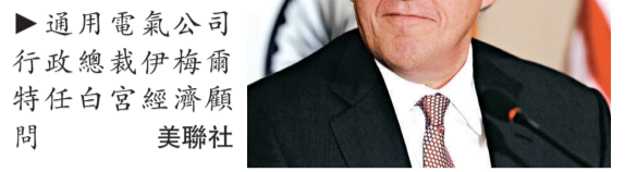
▶通用電氣公司行政總裁伊梅爾特任白宮經濟顧問

【本報訊】據美聯社華盛頓二十日消息：美國總統奧巴馬的任期已經過了一半，儘管兩年來阻礙不斷，但他日前的支持率突然回升。白宮發言人吉布斯 20 日更表示，奧巴馬「很可能」參加 2012 年總統競選，尋求連任。