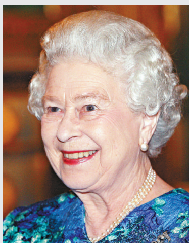
▲英女王表示至今「仍未感到需要」與凱特的父母見面 ▲英國威廉王子與未婚妻凱特將於4月29日舉行大婚 資料圖片

雖然米道爾頓夫婦曾與威廉王子的父親查爾斯及其妻子卡米拉見面，但外界相信，他們開始進入王室圈子是一個緩慢而微妙的過程。