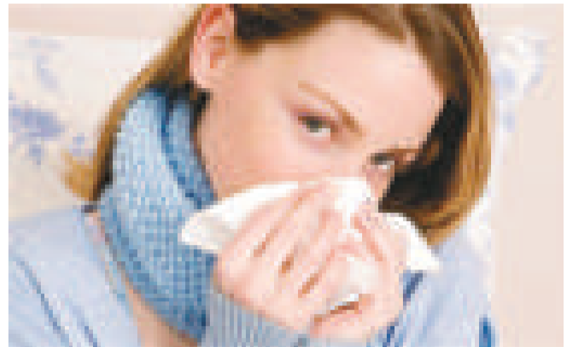
▲調查發現女性請病假比男性多

其他古靈精怪的藉口還有「我找不到鞋子」、「我忘記了自己在這裡上班」、「我把自己鎖在了屋內」、「因為你支付給我的薪金太少未能負擔巴士車費」、「我的男朋友剛剛被槍打中腳部」、「我的汽車被冰封在了路面」。