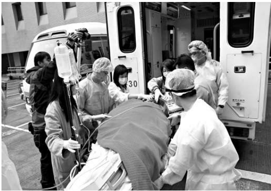
▲一名懷疑感染人類豬流感的病人，昨日由聯合醫院轉送往伊利沙伯醫院

衛生防護中心表示，過去一星期接獲五十九宗院舍及學校流感爆發報告，較對上一星期的十八宗急升兩倍。本周的首兩天，衛生防護中心已錄得十宗爆發報告，包括九龍城浸信會禧華小學三人感染、聖公會偉倫小學五人感染、香港九龍塘基督教中華宣道會陳元喜小學四人感染、嘉諾撒培德學校三人感染、明愛凌月仙幼稚園三人感染、聖公會李兆強小學六人感染、塘尾道官立小學四人感染、何文田浸信會幼稚園六人感染、竹園區神召會南昌康樂幼兒學校五人感染及保良局香港道教聯合會圓玄小學三人感染。