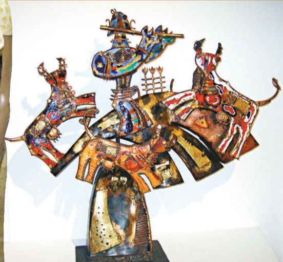
▲南多哥帕爾的作品《克利須那神與牛》，一九八八年，銅、黃銅和玻璃雕塑作品