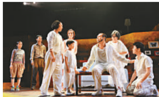
▲《一屋寶貝》三度公演，有很好的票房紀錄

【本報訊】演戲家族正公演溫暖人心的音樂劇《一屋寶貝》，此劇於第十九屆香港舞台劇獎獲四大獎項，囊括最佳整體演出、最佳創作音樂、最佳