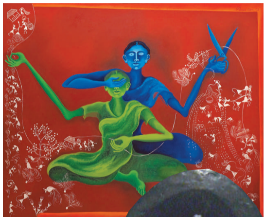
▲帆布油畫《豐收》，作者阿帕特·科爾