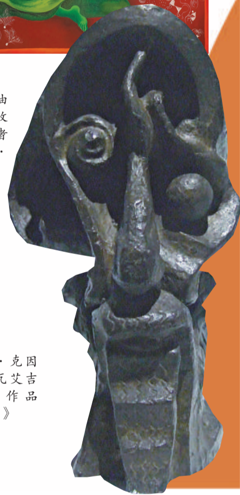
▲拉姆·克因克爾·瓦艾吉的青銅作品《泰戈爾》