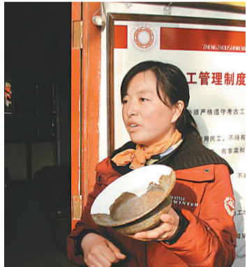
鄭州市文物考古研究院工作人員展示出土的商代原始瓷尊

專家認爲，望京樓夏代城址和商代城址位於同一地點，對於探討夏商歷史、夏代晚期文化與商代早期文化更替及中國早期城池建設等問題都具有重要意義，是極爲重要的考古新發現。