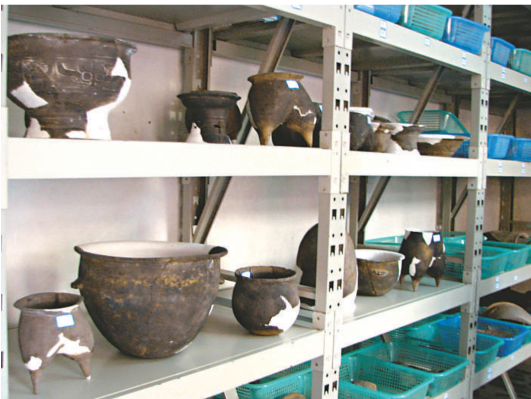
圖爲發掘現場出土的商代原始瓷尊，是目前中國最早的瓷器