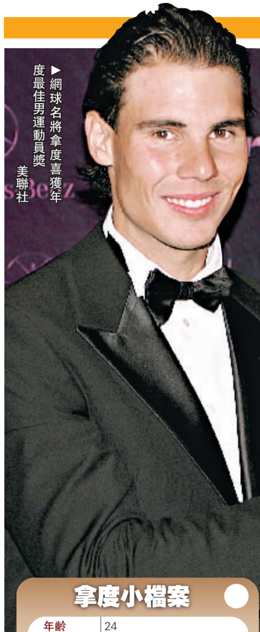
網球名將拿度喜獲年度最佳男運動員獎