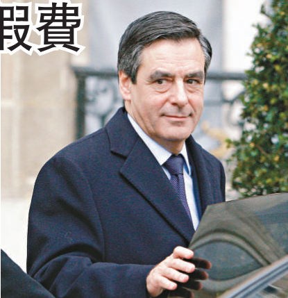
▲法國總理菲永曾接受過穆巴拉克私人接待

在埃及旅遊期間，菲永乘坐穆巴拉克借出的私人專機，由阿斯旺飛往阿布辛貝參觀當地一座著名神廟。菲永又獲安排坐船暢遊尼羅河，相關費用也是由埃及當局支付。據悉，在阿斯旺期間，菲永更和穆巴拉克會晤。