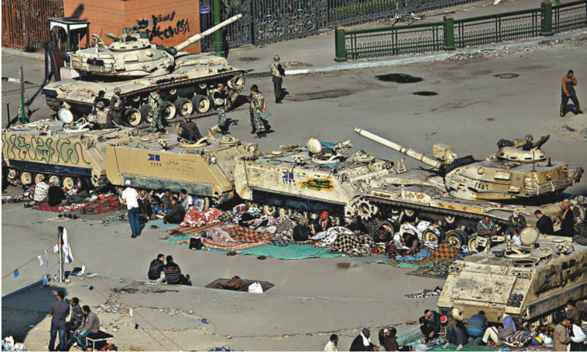
▲開羅的反政府示威者9日躺在坦克旁休息

曾任情報局長的蘇萊曼說，他帶領多年的情報局，為從海外引渡武裝分子到埃及付出了「許多努力」，這些武裝分子和尤其是「基地」組織的極端領導層有關。