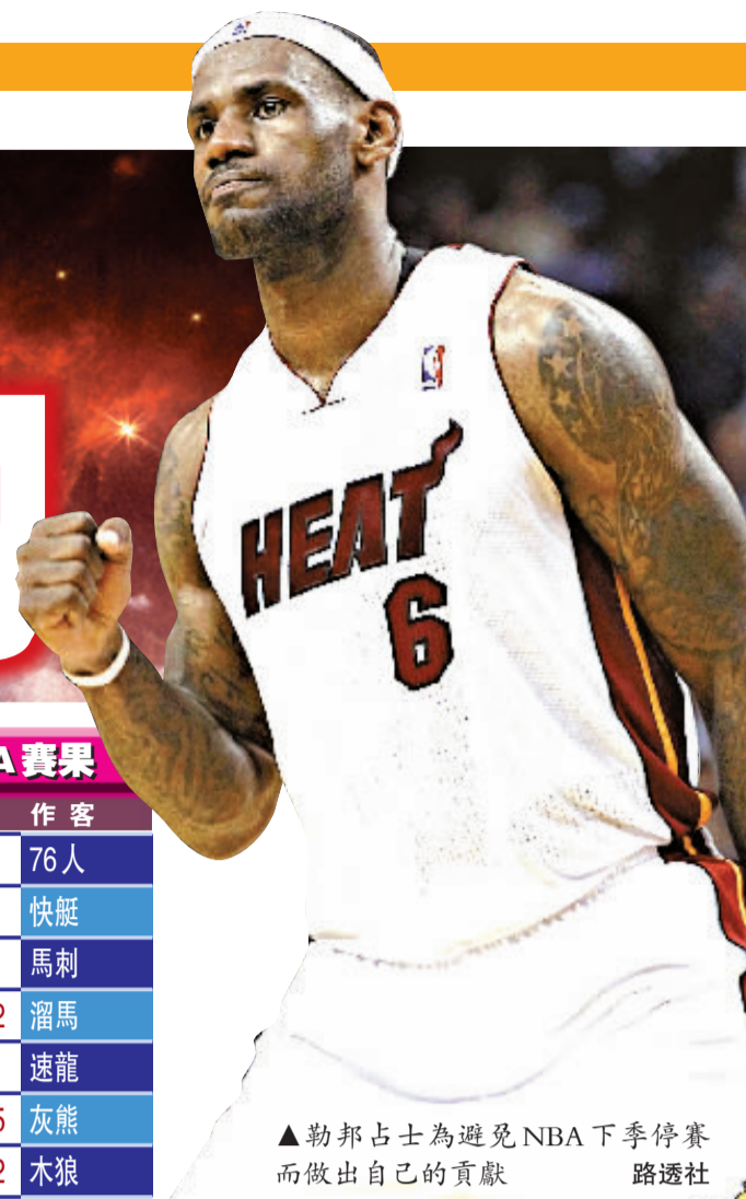
▲勒邦占士為避免NBA下季停賽而做出自己的貢獻

【本報訊】綜合外電美國八日消息：熱火「大帝」勒邦占士表示，他將在明星賽期間參與勞資談判，為避免NBA下個賽季停賽而做出自己的貢獻。 NBA早前宣布，本季已虧損3.5億美元（約27.2億港元），總裁斯特恩透露資方希望每季削減8億美元的球員薪金。NBA現行勞資條款將在今年6月30日到期，由於資方態度強硬，勞資談判一直沒有顯著進展。如果雙方在明星賽期間的談判仍未能就新勞資條款達成共識，下季NBA極有可能繼1998至1999賽季後再次暫停。