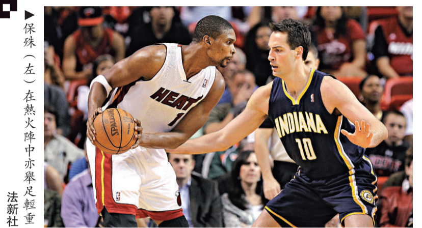
▶保珠（左）在熱火陣中亦舉足輕重

近來拜林在湖人的日子過得並不愜意，狀態不佳的他，幾乎淪為球隊可有可無的角色球員，於是外界紛紛猜測，拜林在湖人的日子就快到盡頭，但基姆巴斯並不這樣認為。 拜林惹被棄猜測 基姆巴斯表示：「想要讓安東尼來湖人，將拜林送到丹佛（金塊）？不要指望了，我們無意這樣做。」