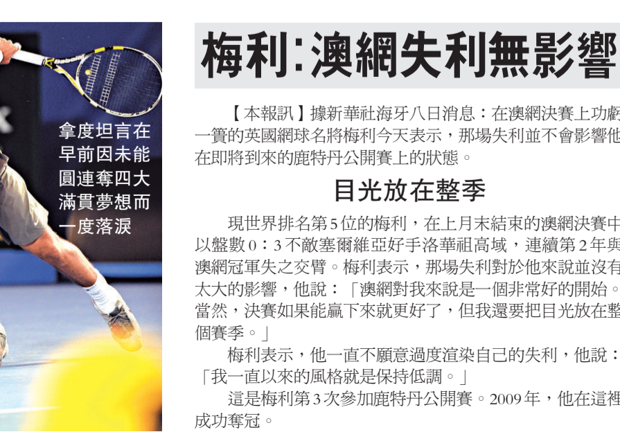
拿度坦言在早前因未能圓連奪四大滿貫夢想而一度落淚

【本報訊】據新華社巴塞羅那八日消息：在剛結束不久的澳洲網球公開賽上因傷鏖戰而歸的世界「一哥」、西班牙的拿度表示，已經從肌腱傷勢中恢復，並將着手為接下來的比賽進行備戰訓練。 在上個月的澳網8強賽中，拿度被同胞費拿直落三盤淘汰出局，在2010年連奪法網、溫網和美網後，連奪四大滿貫的夢想化為「浮雲」。西班牙天才賽後承認，自己曾偷偷流下了傷心的淚水。 不過，好消息是，拿度現在可以回到家鄉西班牙的馬略卡島恢復訓練了，並將備戰下月初戴維斯杯首輪西班牙與比利時的比賽。 「按照計劃找回狀態」 「我現在感覺很不錯，我將回家並回到場地進行訓練。我會慢慢來，按照計劃一步步地找回狀態。」拿度說。