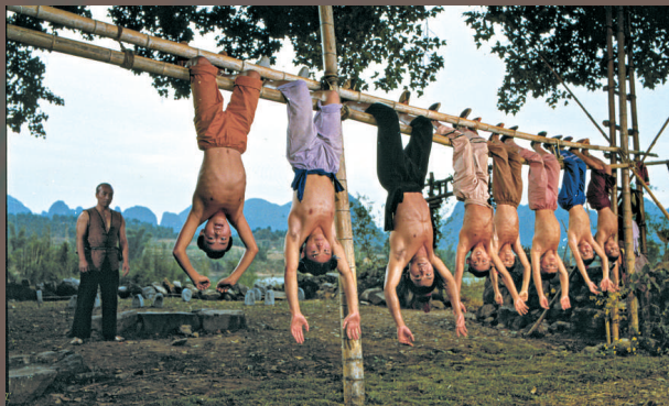
▲武術電影《少林小子》