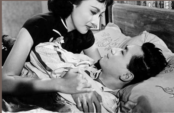
▲長城出品的電影《新寡》由當家花旦夏夢主演