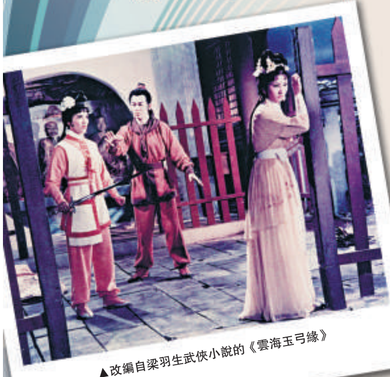
▲改編自梁羽生武俠小說的《雲海玉弓緣》

以王家衛、梁朝偉掛頭牌，銀都機構六十周年獻禮電影《一代宗師》仍在製作階段，而賀壽刊物《銀都六十》一書已如期面世。銀白二色簡約淡雅的封面，承載着的卻是厚重的歷史。