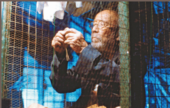
▲為低下層居民發聲的寫實電影《籠民》