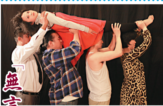
威爾的經典作品「無言天地」劇團演繹歐