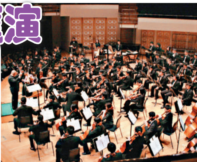
▲香港青年交響樂團

「音樂事務處周年大匯演」門票於各城市電腦售票處公开发售。節目查詢可電二七九六一〇〇三。