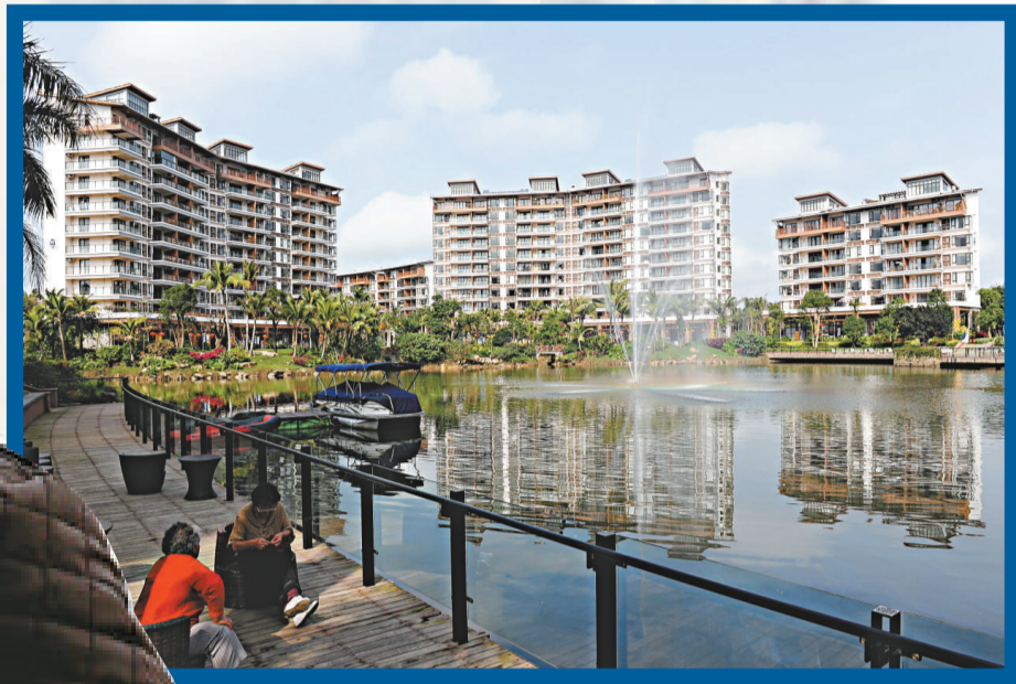
▲專家稱，目前全國房價總體仍呈上漲態勢，樓市調控政策仍將繼續加強

國家統計局今日發布根據新方法統計的70個大中城市1月份房價數據，超過九成城市房價出現同比上漲，其中10個城市同比漲幅超過10%，但新房和二手房均有3個城市環比出現下降。專家表示，目前全國房價總體仍呈上漲態勢，部分城市房價過快上漲態勢尚未有效抑制。房地產調控的方向不能改變，樓市調控政策仍將繼續加強。 【本報記者張靖唯北京十八日電】