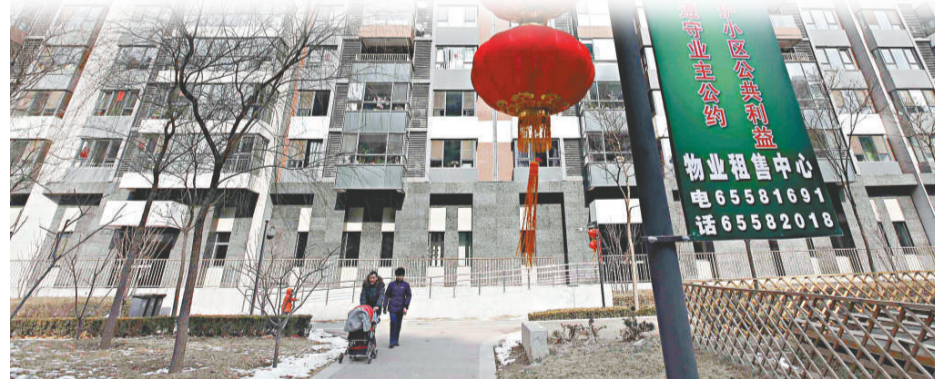
▲1月份北京新建商品住宅同比上漲9.1%

上海財經大學應用統計研究中心主任徐國祥表示，統計數據是否可靠，除調查方案本身外，也離不開被調查者的密切配合。