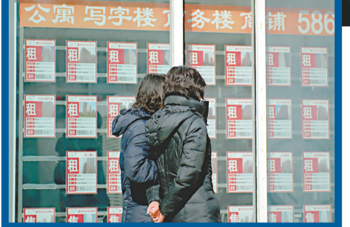
▲「京版國八條」的房地產調控政策明確規定外地在京購房需納稅滿5年