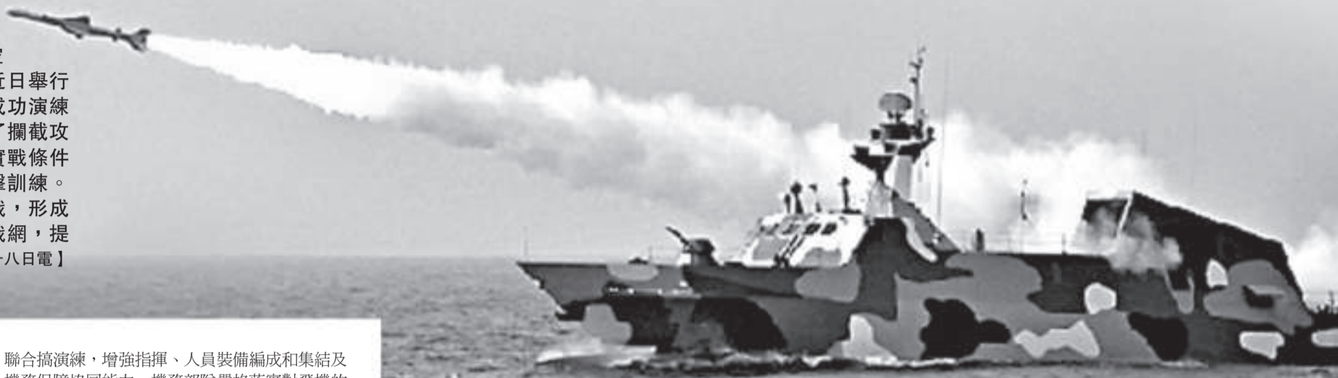
▲北海艦隊 022 型導彈艇開火瞬間 資料圖片

美韓聯合軍演「關鍵決心 (Key Resolve)」即將開始，美國航空母艦將會參加。解放軍北海艦隊航空兵近日舉行演習，加強戰備值班，模擬戰場環境，成功演練了對「敵方」航空母艦艦載機編隊進行了攔截攻擊。而北海艦隊驅逐艦支隊開展了近似實戰條件下防化訓練，潛艇支隊實彈發射魚雷攻擊訓練。不同武器裝備互相配合，多兵種協同作戰，形成了空中、水面、水下三位一體的立體化戰網，提高了戰力。【本報記者馬浩亮北京十八日電】