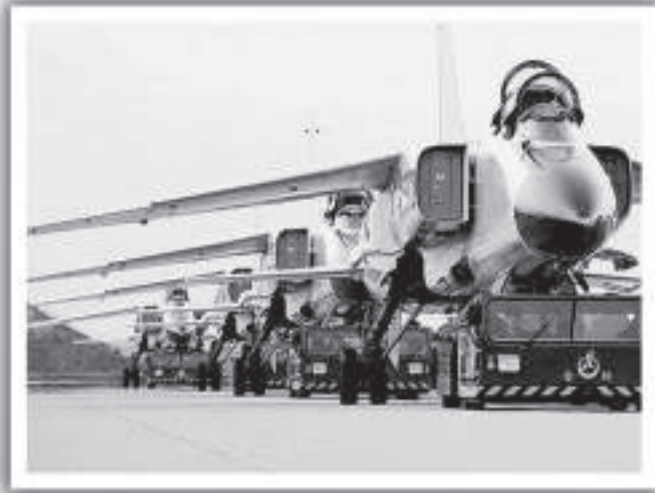
▲北海艦隊某航空兵團準備組織飛行訓練 資料圖片

美韓聯合軍演「關鍵決心 (Key Resolve)」即將開始，美國航空母艦將會參加。解放軍北海艦隊航空兵近日舉行演習，加強戰備值班，模擬戰場環境，成功演練了對「敵方」航空母艦艦載機編隊進行了攔截攻擊。而北海艦隊驅逐艦支隊開展了近似實戰條件下防化訓練，潛艇支隊實彈發射魚雷攻擊訓練。不同武器裝備互相配合，多兵種協同作戰，形成了空中、水面、水下三位一體的立體化戰網，提高了戰力。【本報記者馬浩亮北京十八日電】