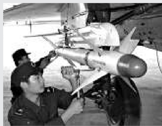
▲北海艦隊航空兵某部檢查彈藥 資料圖片

並且，除彈道導彈以外，中國還可能使用巡航導彈，如配有核彈頭的東海-10 巡航導彈，或是配有常規彈頭的 C-602、C-802 或 C-803 導彈。這些導彈可以從飛機、艦船或潛艇上發射，能從幾個不同的方向接近目標。另外，彈道導彈或巡航導彈可運載核彈頭並在目標艦船的上空爆炸，以破壞其電子設備。而中國可以利用海上偵察機、潛艇、衛星、超視距雷達或漁船來追蹤美國艦船。