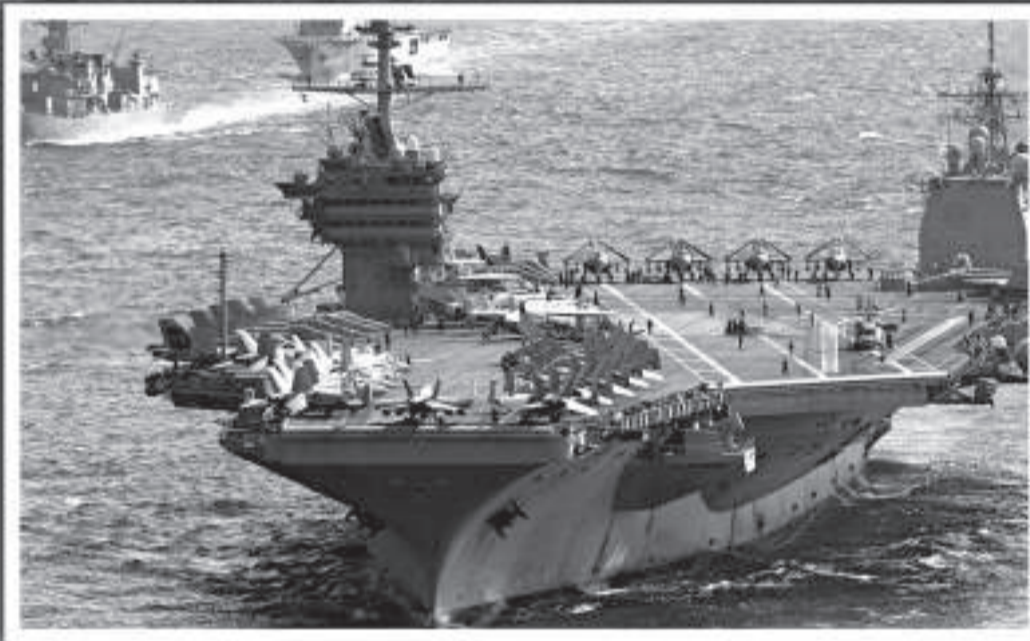
▲將會參加美韓軍演的航空母艦

而值得注意的是，繼去年在黃海海域進行聯合軍演之後，美韓兩國商定從本月底到三月中旬同時舉行年度例行的代號為「關鍵決心」和「禿鷲」的聯合軍演。軍演一改過去對朝鮮半島局勢的判斷，首次以朝鮮政權交接為假想目的，還將派出航母參與。