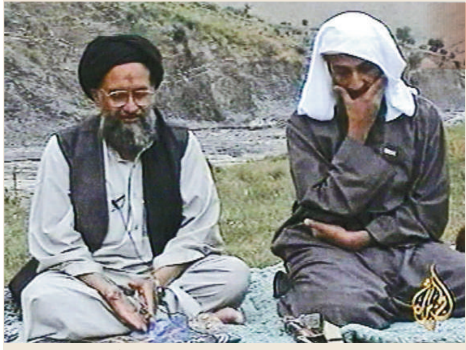
▲「基地」組織領導人拉登(右)與第二號人物扎瓦希里 資料圖片

【本報訊】巴林局勢緊張，港府昨日將對巴林的外遊警示提升至紅色級別。永安旅遊一個中東郵輪團的行程受影響，取消原定星期五停泊巴林的計劃。 保安局表示，會密切留意巴林當地局勢，評估是否需要再提升警示級別。當局呼籲市民，如非必要應避免前赴巴林，而身在當地的港人應注意安全，避開示威或人群聚集的地方，並留意事態發展。 旅遊業議會總幹事董耀中表示，巴林屬較冷門的旅遊地點，香港往巴林的旅行團以郵輪觀光為主，現時並無香港旅行團在巴林，但不排除有自由旅客在當地。 永安旅遊一個今日出發的31人郵輪旅行團，原定星期五停泊巴林港口，然後有半日岸上觀光。永安旅遊董事總經理陳淑芬表示，接獲郵輪公司通知，已將停泊地點更改在阿曼港口。 保安局發言人稱，身在外地的港人如需要協助，可致電入境事務處協助在外香港居民小組24小時熱線(852) 1868。 中國駐巴林大使館發言人接受查詢時稱，當地有約2000名華僑，包括大約20名常駐當地的香港人，示威衝突爆發至今，暫未收到中國公民受傷的報告，當地也未出現針對華人與華人經營店舖的情況，暫時不需要撤僑，當局會密切注視局勢發展。