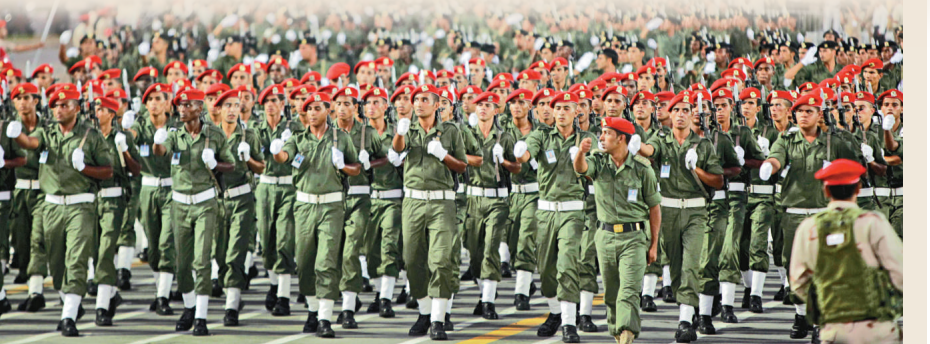
▲2009年9月，利比亞舉行大閱兵

派駐倫敦的利比亞記者薩米斯報道，一群示威者周五成功攻入班加西市內的庫瓦菲耶監獄，放走了數十名政治犯。利比亞《Quryna報》則報道，有多達1000名囚犯越獄，其中150人已被擒回。