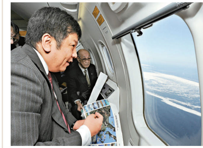
▲日內閣官房長官枝野幸男空中視察北方四島 路透社

【本報訊】據新華社東京19日消息：日本內閣官房長官枝野幸男19日乘坐海上保安廳飛機從空中視察了北方四島(俄羅斯稱南千島群島)。 據日本媒體報道，枝野當天下午在視察北方四島的過程中，一邊聽取海上保安廳工作人員的介紹，一邊了解國後島、齒舞島與北海道的地理位置。 枝野視察後對日本記者說，北方四島與北海道的距離比想像的近，如果日本人知道距離如此近，就會對北方四島問題更加關注。枝野還表示，日本願與俄羅斯在冷靜的環境下就北方四島問題進行實質性談判。 去年11月，俄羅斯總統梅德韋傑夫登上南千島群島(日本稱北方四島)中的國後島視察。這是俄羅斯國家元首首次視察俄日爭議島嶼，日方對此表示強烈不滿。此後，俄方又有包括第一副總理舒瓦洛夫和國防部長謝爾久科夫等人在內的多名高官先後對這些島嶼進行視察。日本外相前原誠司及部分日本議員也先後從空中視察北方四島。