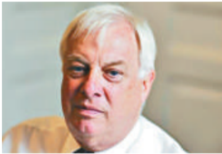
由是無法撥足夠時間履行職務。 英國廣播公司的信託管理機構主席年薪11萬英鎊，機構負責制訂公司的策略方針，獨立於公司的管理層。

【本報訊】據英國《衛報》、《泰晤士報》報道，英國執政保守黨前主席、香港最後一任總督彭定康(Chris Patten, 見圖)，料會獲委任為英國廣播公司(BBC)的管理機構BBC信託(BBC Trust)的主席。執政保守黨及自由民主黨聯合政府文化部將會在未來一周內，正式公布這項任命。 現任文化大臣侯俊偉(Jeremy Hunt)已向首相卡梅倫推薦彭定康出任這個職位。角逐此職的共有5人，除了彭定康外，最有實力與他「拗手瓜」的是《金融時報》前任編輯兼英國工業聯合會前幹事長林伯特(Richard Lambert)。 在當局決定BBC信託主席的最後人選前，在野工黨的影子文化大臣劉易斯周五晚表示：「不管是彭定康還是其他人也好，BBC信託新任主席所面對的考驗，是他是否願意站出來捍衛BBC的利益。新主席也要保持強勢，確保BBC管理層要對公司的未來方向作出重要決定時，要問責及保持透明度。」 BBC信託主席現時由萊昂斯爵士出任。他經常被保守黨抨擊，指他與工黨的關係太密切，而萊昂斯也無意角逐連任，理由