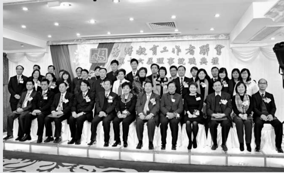
▲主禮嘉賓與教聯第十六屆理事會合照