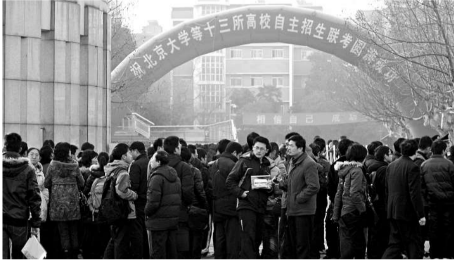
▲20日清晨，許多考生和家長在南京師範大學附屬中學考點門外等候