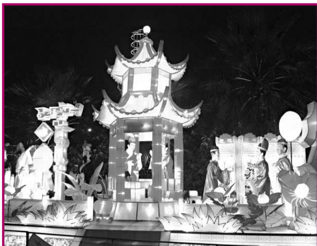
▲栩栩如生的大型花燈組合《潮州八賢》