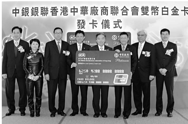
▲「中銀銀聯香港中華廠商聯合會雙幣白金卡」發卡儀式

中國銀行（香港）有限公司（簡稱「中銀香港」）、香港中華廠商聯合會（簡稱「廠商會」）及中國銀聯日前攜手推出「中銀銀聯香港中華廠商聯合會雙幣白金卡」。這張具有雙幣功能的聯營卡專為廠商會會員而設，特別適合經常穿梭香港和內地，或到海外公幹旅遊的廠商會會員使用。