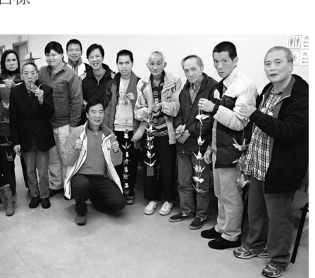
▲義工與舍友共同製作紙鶴掛飾，為中心添姿彩

集團上下員工在活動前利用循環物資親手摺製逾2000隻紙鶴，為中心舍友送上祝福之餘，亦可裝飾院舍。此外，集團亦贈送逾600件暖衣予中心舍友及與舍友共同製作紙鶴、十字繡、曲奇及種植盆栽，共度一個溫暖窩心的上午。歡樂之餘，集團亦不忘保護環境，為是次活動購買碳排放額作出抵銷，以達致「碳中和」的目標。