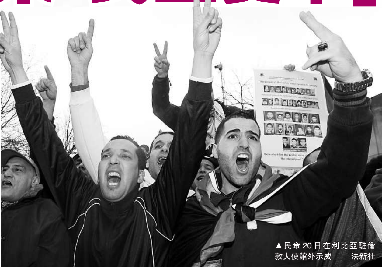
▲民眾20日在利比亞駐倫敦大使館外示威

活水平的機會，這絕對是至關重要的，不可以使民主在中東獲得污名，如同上世紀90年代民主在俄羅斯獲得污名那樣。」