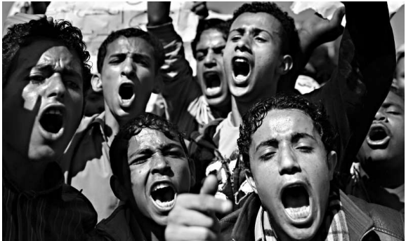
▲也門反政府示威者21日高喊要總統下台的口號

卡梅倫抵達中東之時，海灣及北非地區多個阿拉伯世界政權正在遭遇反對它們的示威浪潮。卡梅倫在前往開羅途中說：「這是一個很好的機會，讓我們動身與目前管治埃及的人見面，確定這確是由軍人管治過渡到文人管治，並看看友好國家，如英國及歐洲其他國家，可以提供什麼協助。」