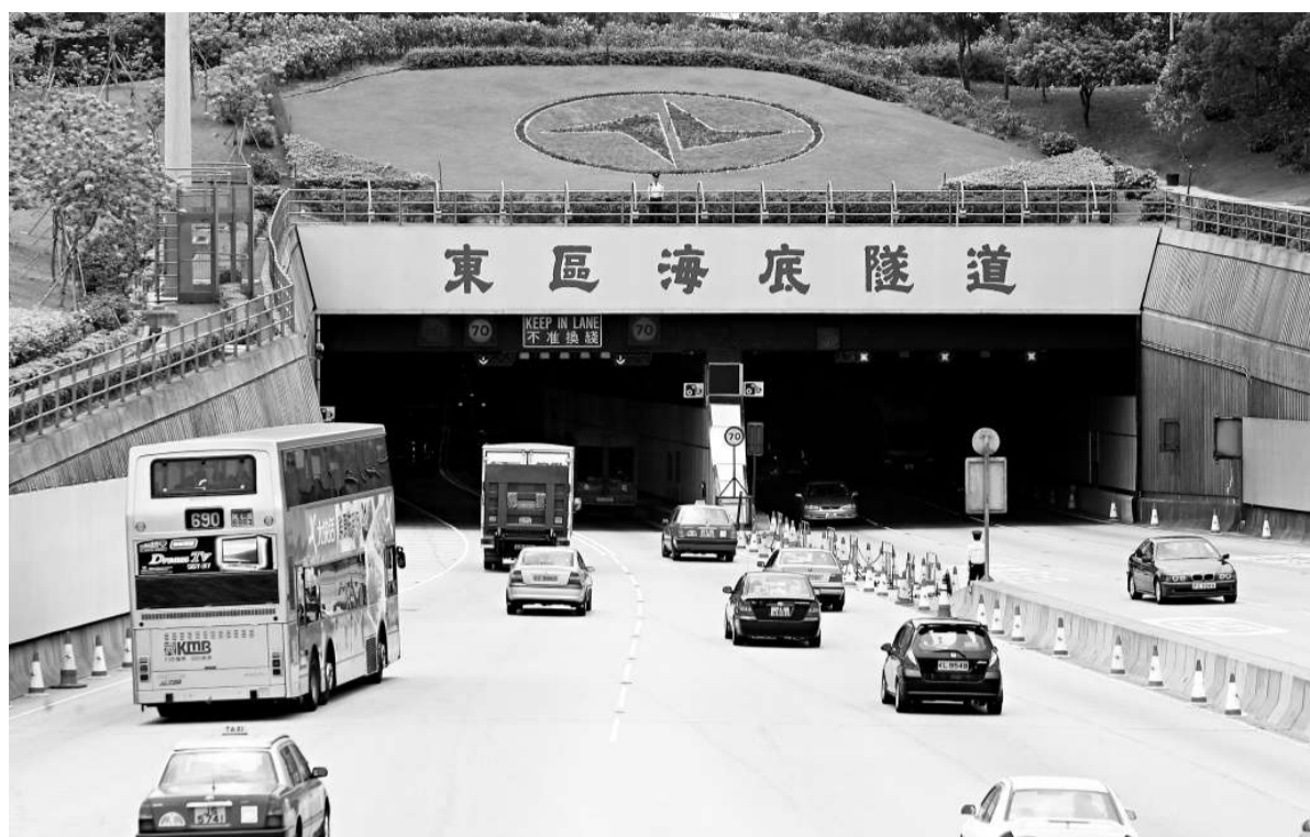
▲立法會交通事務委員會將於本星期五討論東隧加價事宜

需要在現時經濟環境下加價，以及時機是否合適；當局亦提醒東隧在釐定收費時，需平衡公眾利益及商業考慮因素，並顧及市民的負擔能力及接受程度。當局透露，曾向東隧游說，但東隧卻堅持加價四成。有關加幅仍有待交諮會討論和行政會議審批。