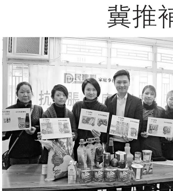
▲民建聯籲政府撥五億加強食物援助計劃，紓緩基層通脹壓力

【本報訊】一項物價調查顯示，今年食品和生活用品價格均較去年有不同升幅，當中水果價格升逾三成，衛生紙升一成三，米、油等升近一成。負責調查的政黨建議，政府在明日公布的財政預算案中，撥款五億元加強食物援助計劃，紓緩低收入家庭面對食品通脹壓力，並設立三百億元公共交通收費穩定基金，派發電費補貼和寬免差餉等。民建聯家庭事務委員會早前進行物價調查，比較今年和去年同期在大型連鎖超市的食品、日用品和賀年食品的價格。結果發現，價格差異由百分之二點七至三成不等，當中水果的升幅最大，超過三成；其次為清雞湯和衛生紙，升一成三；各類飲品升百分之六點二至近一成；米、油和醬油升幅由百分之六點四至一成不等。部分賀年食品加幅超過一成。