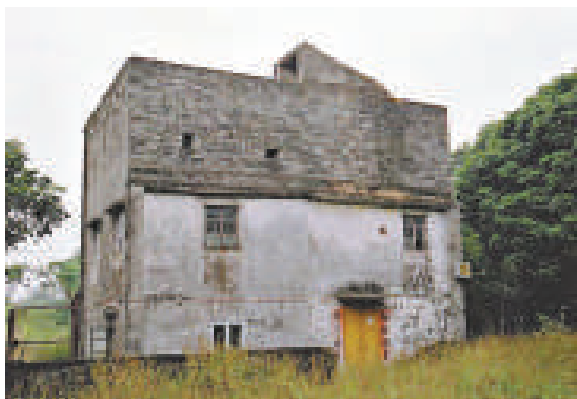
▲建於1910年的白泥青磚碣堡是與辛亥革命直接有關的歷史建築

另外，油街12號前香港皇家遊艇會會所活化計劃是建於一九〇八年的二級歷史建築，現正進行文物影