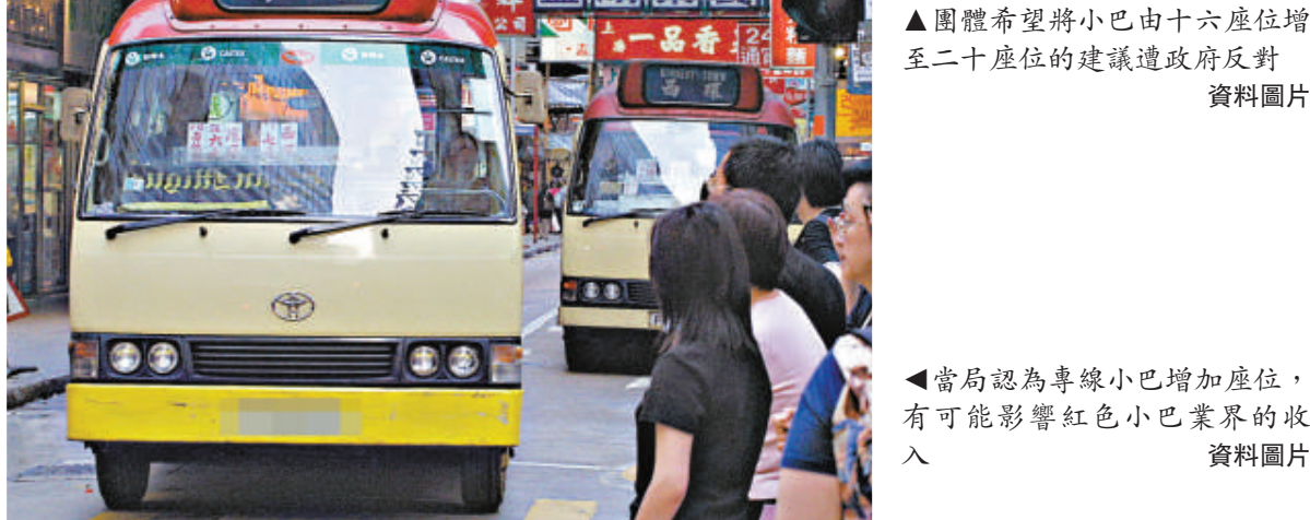
▲團體希望將小巴由十六座位增至二十座位的建議遭政府反對