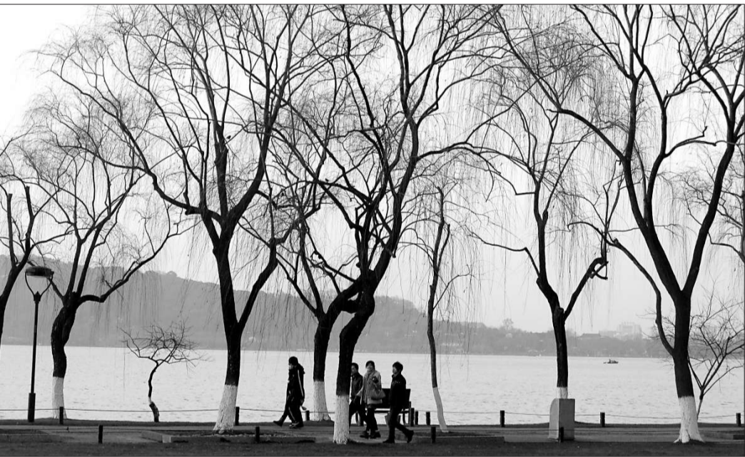
早春二月

張充和的書法以楷書為主，據我看來，真是娟秀無比，足見功力深厚，而且博採衆長。白謙慎評說道：「沈尹默先生曾以『明人學晉人書』評之，堪稱允當。」明人學晉人，又是指何人？明人是指明代中期的王寵，他的楷學二王，娟秀非凡。白謙慎研究傅山書法很