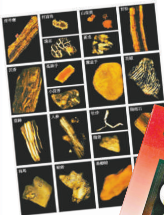
▲至寶三鞭丸部分組成藥物在偏光顯微鏡下的特徵

回國時我將這些研究成果提交給了中國藥典委員會，希望能對國內的中藥鑒定工作有所幫助。其後我應邀擔任主編，與中國藥典委員會的專家們共同出版了《中華人民共和國藥典中藥粉末顯微鑒別彩色圖集》。這本專著為從事中藥檢驗、教學、科研、生產、供應和使用的人員提供了實用參考。目前，我和我的研究組也正在繼續積極參與《中國藥典》2015版的編制工作。 (未完·待續)