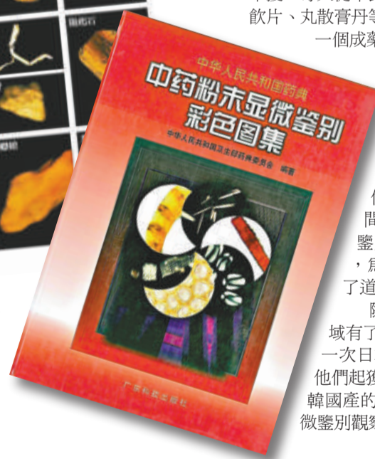
▶《中藥粉末顯微鑒別彩色圖集》