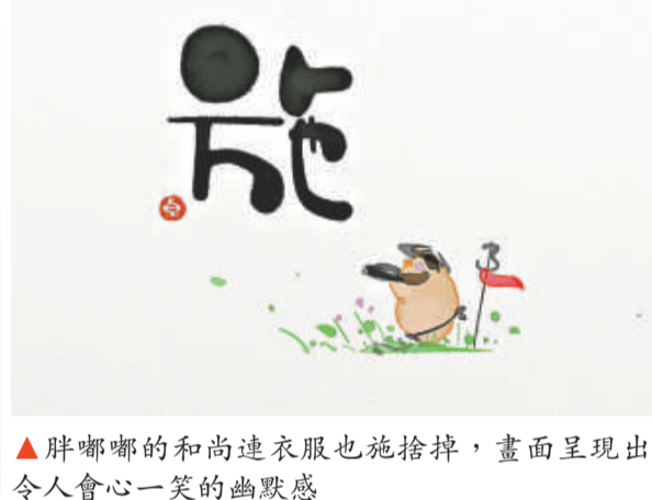
▲胖嘟嘟的和尚連衣服也捨棄掉，畫面呈現出令人會心一笑的幽默感