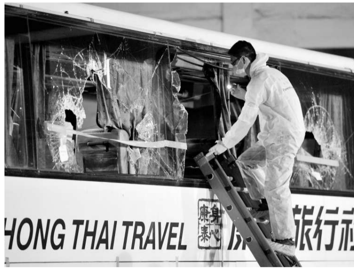
▲政府高級化驗師曾登上旅遊巴蒐證