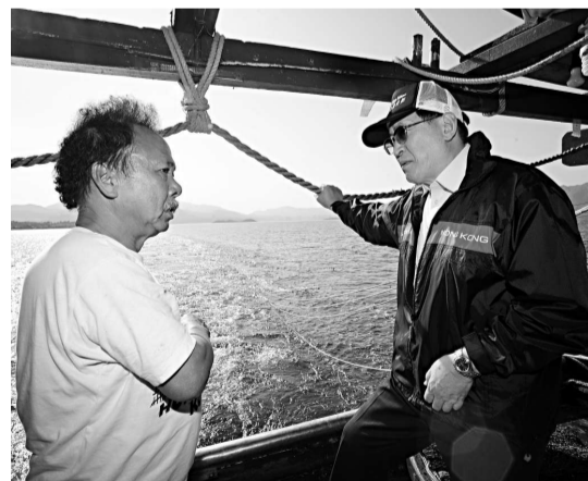
▲周一嶽（右）昨與四個自然保育團體代表會面，討論政府建議日後禁止拖網捕魚及其他漁業管理措施

本港捕撈漁業現有三千九百艘捕撈漁船，其中約一千一百艘為拖網漁船。有鑑於禁止拖網捕魚將影響拖網漁民生計，政府建議向符合申請資格的拖網漁船船東，發放特惠津貼及推出自願性回購拖網漁船計劃，並向自願交出其拖網漁船的船東所備用的本地漁工發放補助金。漁農自然護理署將為漁民推出特別培訓計劃，鼓勵他們轉行從事其他可持續發展的漁業。