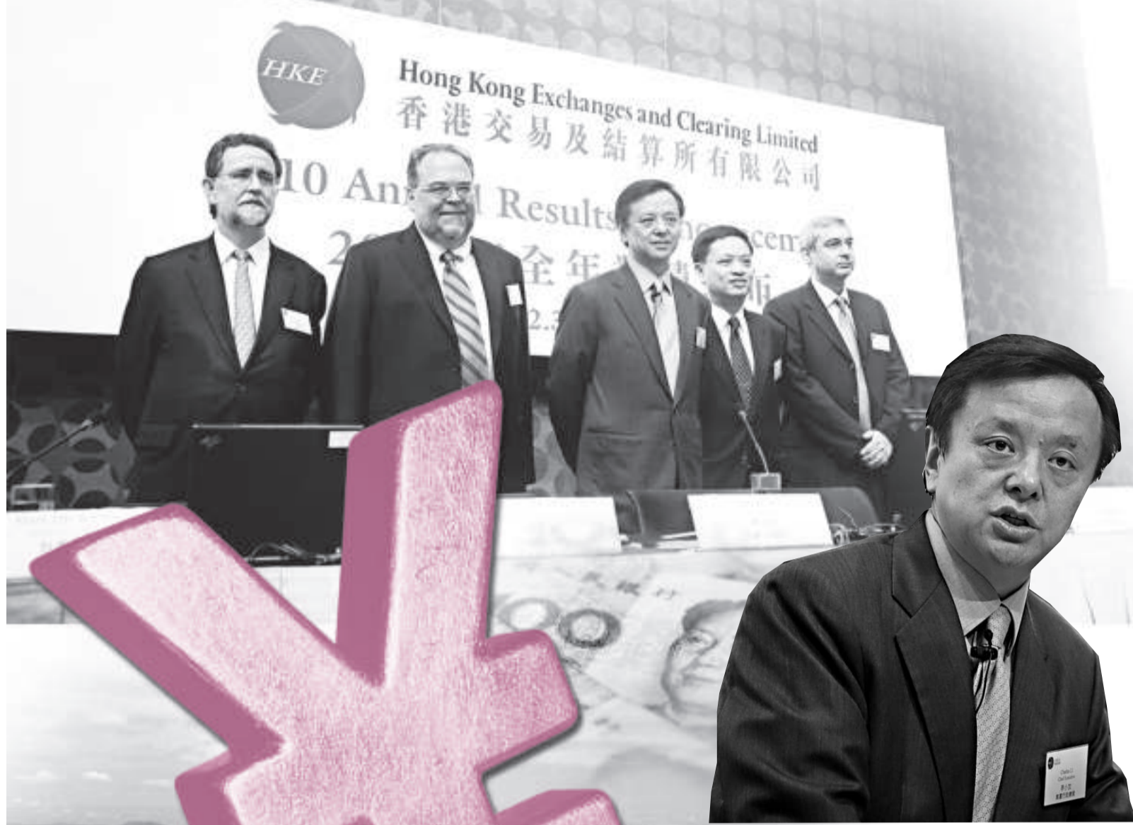
▲港交所行政總裁李小加

港交所昨日公布2010年度業績，營業額75.66億元，上升8%，股東應佔溢利50.37億元，增長7%，每股攤薄後盈利4.67元，建議派發末期息2.31元，增加11%。截止過戶日期4月15日。