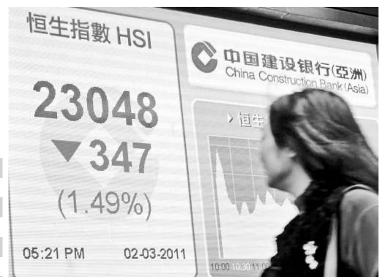
▲恒指收市報23048點，跌347點，主板成交縮減至700億元