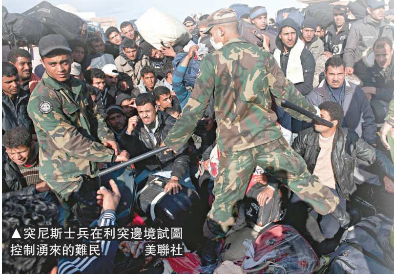
▲突尼斯士兵在利突邊境試圖控制湧來的難民

根據聯合國人道主義事務協調辦公室公布的數字，截至周二，累計有147,000名利比亞人逃離國外