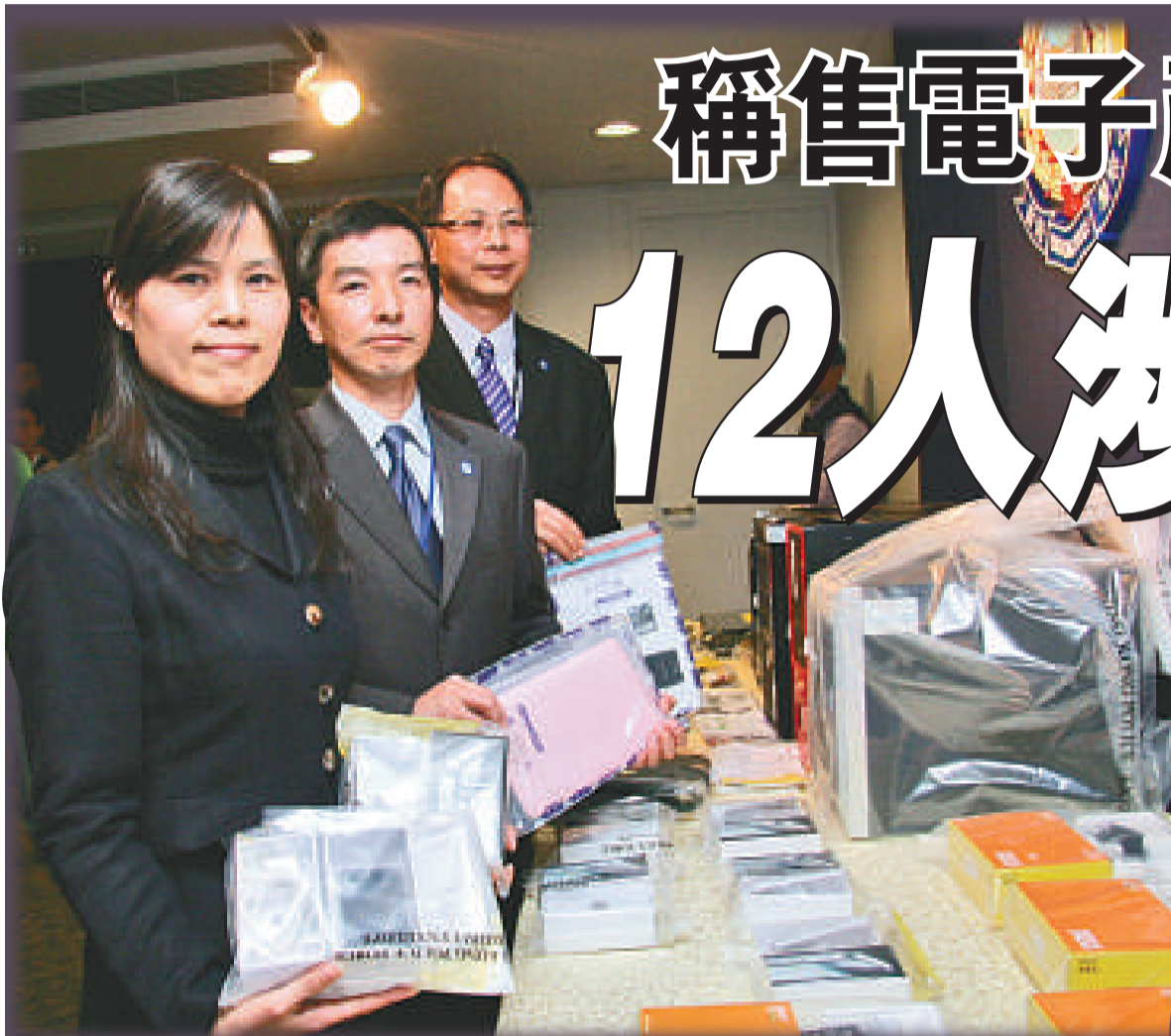
▲警方檢獲大批電腦、銀行存摺等證物