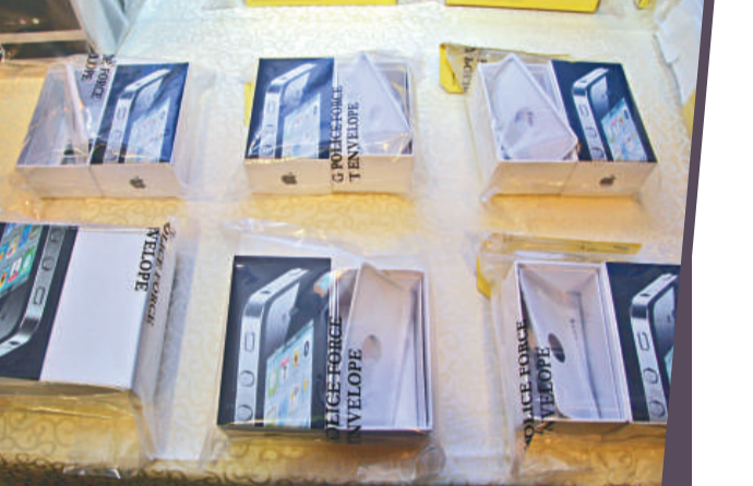
▲騙徒訛稱發售新款電子產品，但收錢後只寄出空盒或假貨