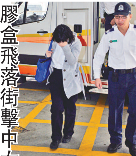
▲臉遭擊傷的女子往醫院檢查

專科醫生指出，人體頸椎位置非常脆弱，一旦受傷會很危險，徵狀包括肢體全部或部分出現麻痺、不能移動，甚至大小便失禁，嚴重時可能因神經線受損，影響呼吸系統和循環系統，引致窒息及血壓下降而死亡。