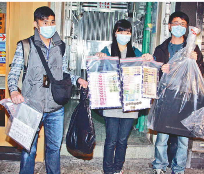
▲警方檢獲電腦、數簿及一批現金