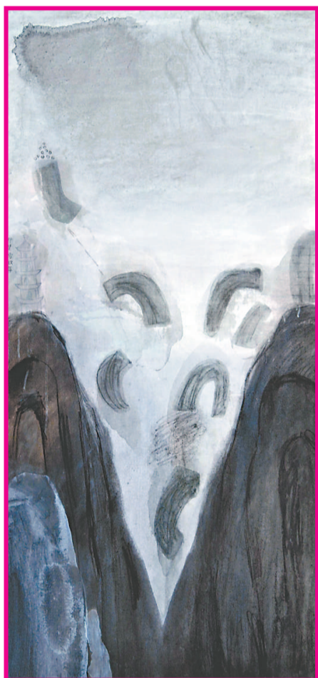
王伊楚 《塵》 布面丙烯