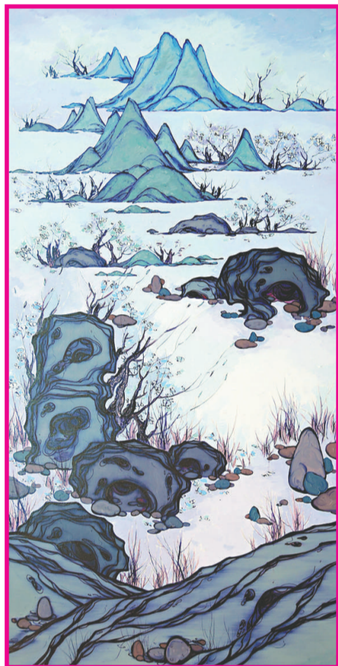
沈娜 《近水遠山皆有情》 布面油畫