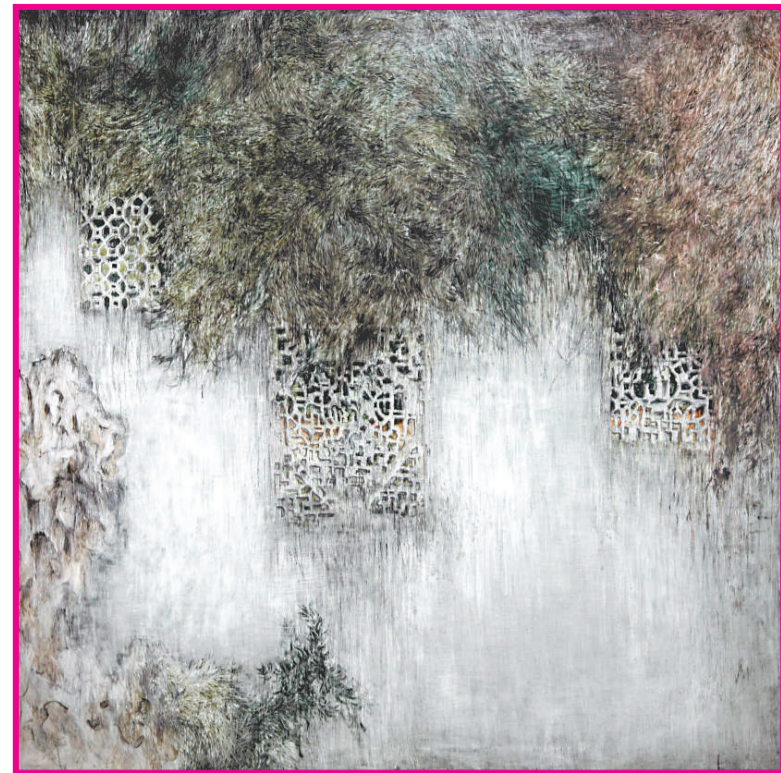
謝正莉 《花窗》 布面丙烯

無論怎樣，持續的對女性藝術的關注和不斷地為女藝術家做展覽是有意義的，只有給她們提供足夠的空間展現自己，才能消弭所謂的性別偏見。我們相信實踐比理論上無休止的論辯也許更切實可行，這最終必將會對當代藝術的多元發展提供幫助。我們希望這種帶有嘗試性的展覽與研究能夠延續下去，其衍生的學術話題也令我們充滿期待。