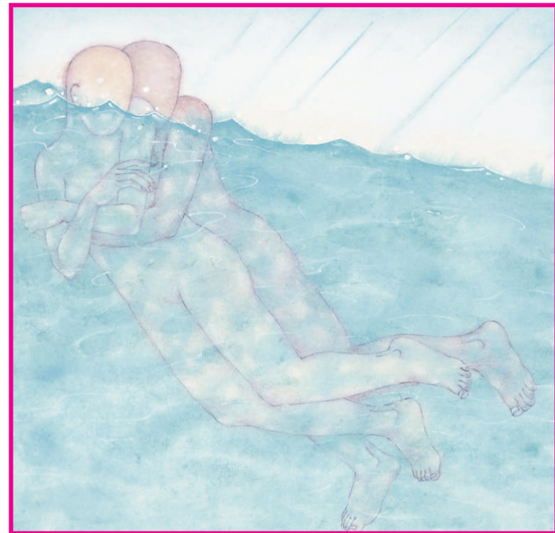
李戈暉 《取暖》 彩墨