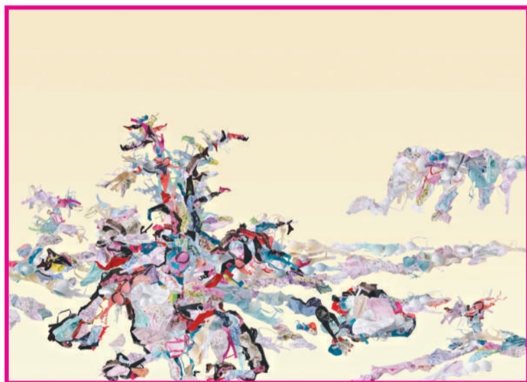
段舜婭 《風景》 拼貼