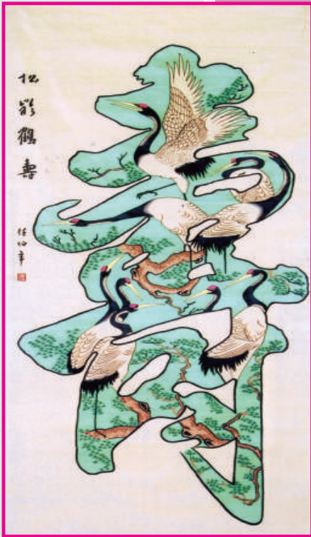
仿任伯年《松影鶴壽》