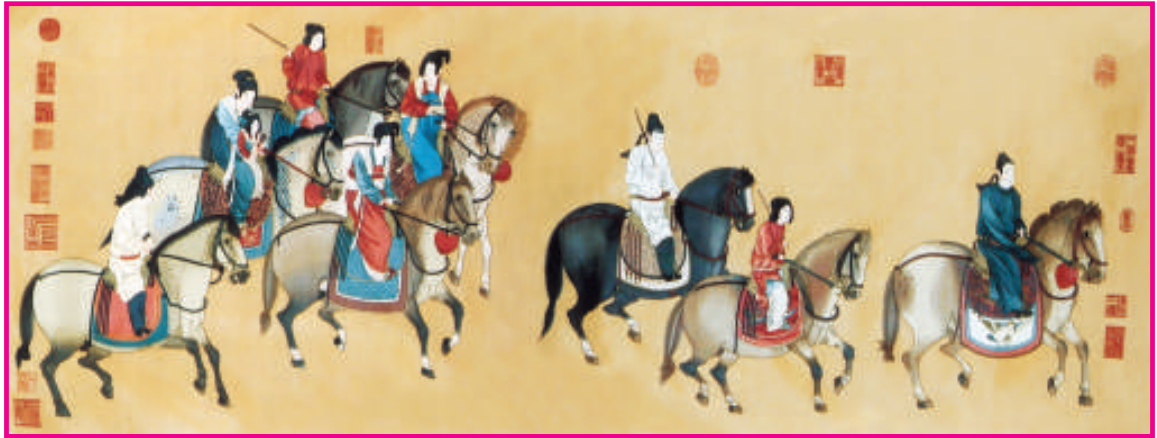
仿唐代名畫《遊春圖》