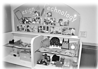
設計與工藝科的學術角

為積極推動同學的學術水平與學校的學術發展，近兩年來，位於荃灣的保良局李城璧中學推行了多項相關的政策。當中最矚目的，乃連月來動員學校各學術學會，在校園定點完成與本科相關的「學術角」。