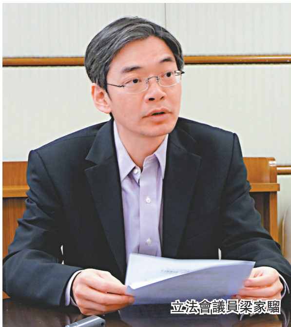
立法會議員梁家驊

醫院管理局每年獲政府撥款逾百億元，但專科輪候時間有增無減，等候最長的個案以年計算，公共醫療慘變「大白象」。醫學界立法會議員梁家驊批評醫管局「三錯」，錯配聯網資源、錯配專科服務及錯無透明度；明日將在立法會動議改革醫管局，包括重整專科服務，以及定期交代撥款使用詳情，並強調改革亦需政府的推動。