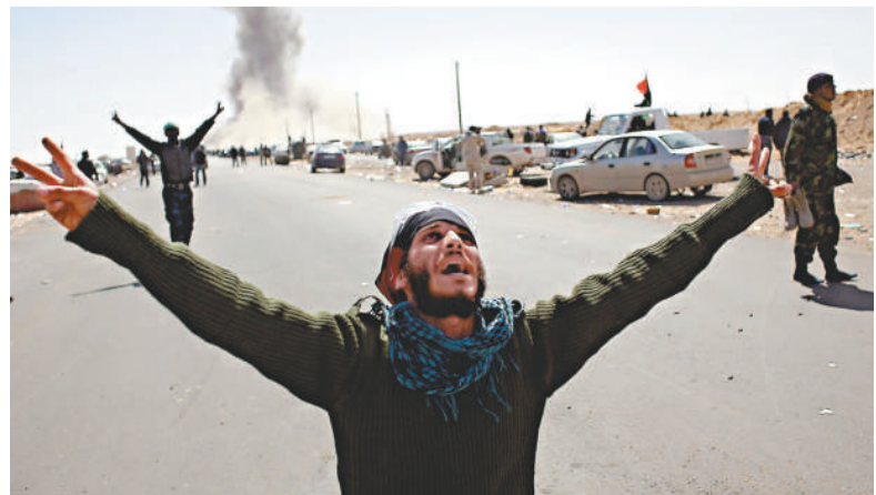
▲一名利比亞反對派7日在拉斯拉努夫高呼勝利