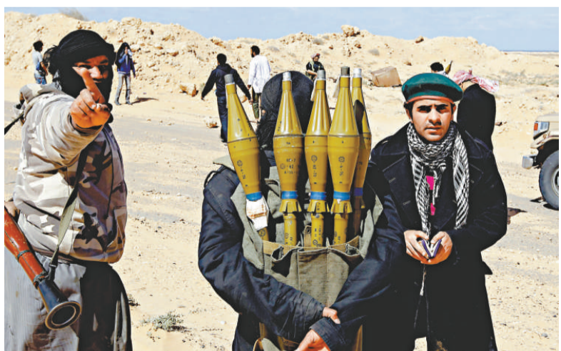
▲利比亞反政府武裝分子背着火箭彈

現時有襲擊範圍覆蓋利比亞首都的美國第26海軍陸戰隊遠征隊可供調遣，該部隊部署在兩艘兩棲進攻艦「奇爾沙治」號和「龐塞」號上。該遠征隊可迅速調動全面的海陸軍事力量，出擊數百英里內的地區。