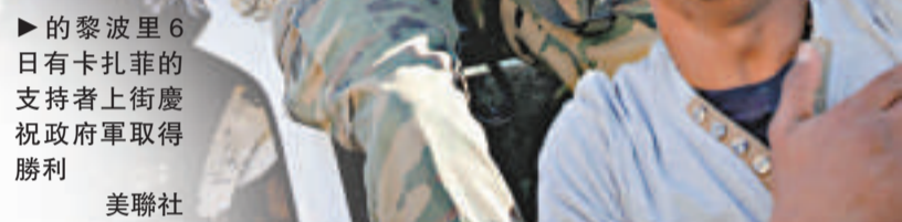
▲的黎波里6日有卡扎菲的支持者上街慶祝政府軍取得勝利 美聯社

他說，一旦利比亞的反政府動亂成功，伊斯蘭聖戰會席捲地中海，「基地」恐怖組織領袖拉登就會得逞。