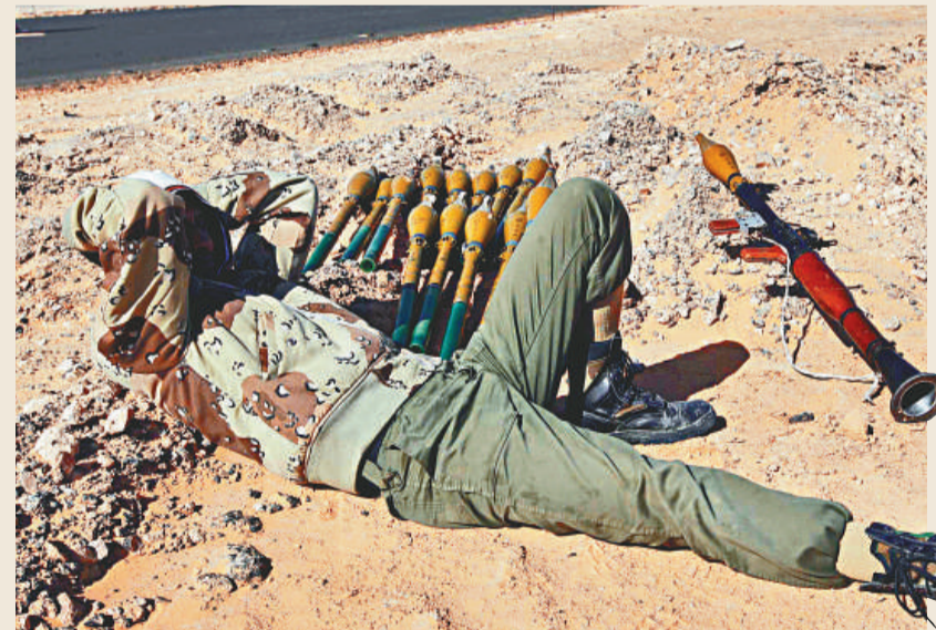
▲利比亞反政府武裝分子在公路旁休息