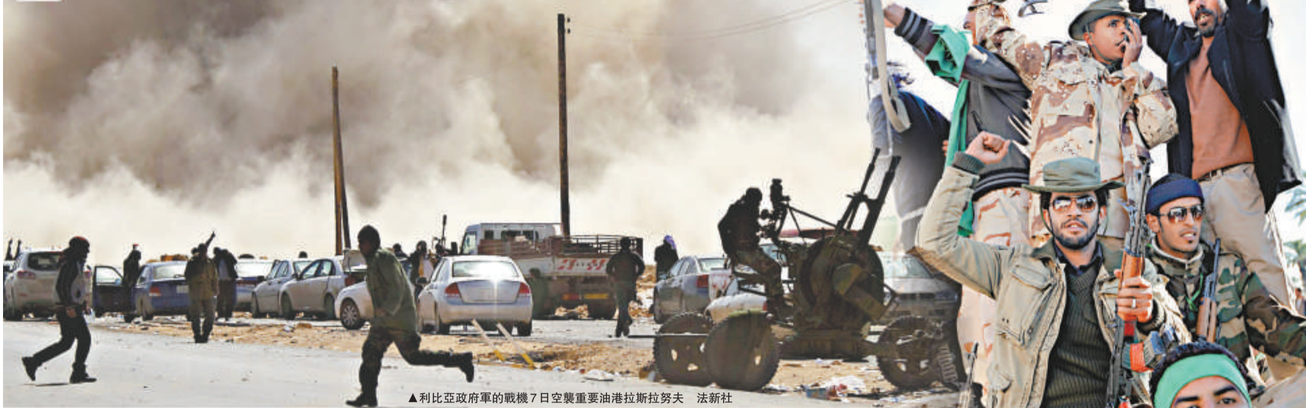
▲利比亞政府軍的戰機7日空襲重要油港拉斯拉努夫

【本報訊】據英國《獨立報》、《華盛頓郵報》7日報道，美國正和海灣盟國沙特阿拉伯秘密協商向利比亞反對派提供武器的計劃。據報華府要求沙特向利比亞第二大城市班加西的反政府武裝提供反坦克火箭、迫擊炮和地對空導彈。