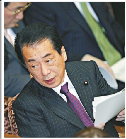
▲日本首相菅直人希望松本剛明可以延續前原誠司的外交政策 資料圖片

松本稱得上是民主黨內的「優良股」，雖然他與前原無論在防衛還是外交上都基本志同道合，堅定主張日美同盟，但他的個人魅力目前還遠不及前原。特別是日本人目睹過太多名家出身的前首相們能力、素質那樣不堪，現在名家出身的「太子黨」在日本普羅大眾的眼裡，倒可能反而是「負遺產」。