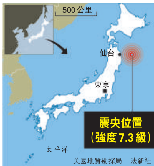
震央位置 (強度 7.3 級)

東日本鐵路公司透露，受地震影響，東北新幹線白石藏王至新青森區間為確保安全一度停運。東北電力公司和東京電力公司稱，宮城縣水川核電站和福島第一、第二核電站並未因地震出現異常，核電站目前運轉正常。