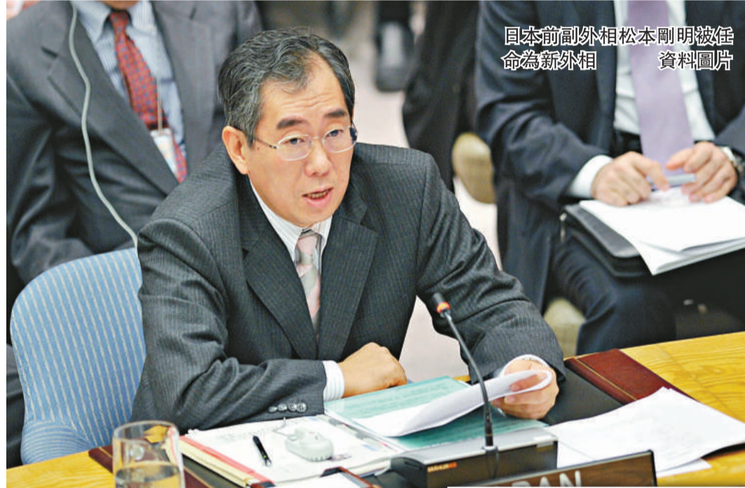
日本前副外相松本剛明被任命為新外相 資料圖片

為民主黨認可的候選人首次當選，至今 4 次當選眾議員。曾經作為最大在野黨的民主黨為了在黨內激發尊權的鬥志，成立「下屆內閣」。研究日本防衛的松本 2003 年就任「下屆內閣」的防衛廳長官，開始與研究同一課題的前原誠司結緣。