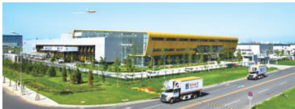
北京航空食品有限公司新配餐大樓