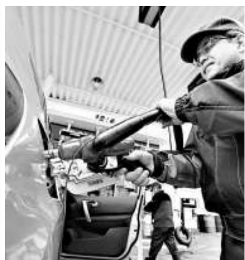
▲紐約4月期油一度跌至每桶99.01美元

在周四，美國財政部拍賣一批30年期債，市場反應甚佳，投標需求創2000年以來最高水平，投資者對美國首次申請失業金人數上升感憂慮，擔心復蘇不穩。美債價格升，30年期及10年期債息都跌。10年期債息跌至1個月低位，市場傳出各種利淡消息，包括穆迪調低西班牙評級，中國出口減慢，有報道稱沙特警察向示威者開火等，投資者對經濟增長前景憂慮，吸引資金流入美債。而聯儲局亦表示，將於未來1個月購買1020億美元國債。分析員表示，美國拍賣債券成績理想，顯示需求強勁。