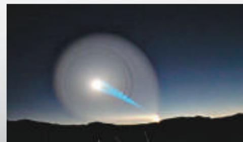
2009年挪威居民目擊巨型螺旋體光，以為是UFO，後來證實是俄羅斯導彈試驗失敗後產生的神秘效應

(美國科學網站：Life's Little Mysteries、《紐約時報》、BBC)