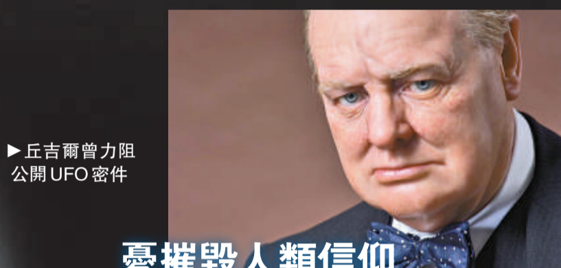
▶丘吉爾曾力阻公開UFO密件