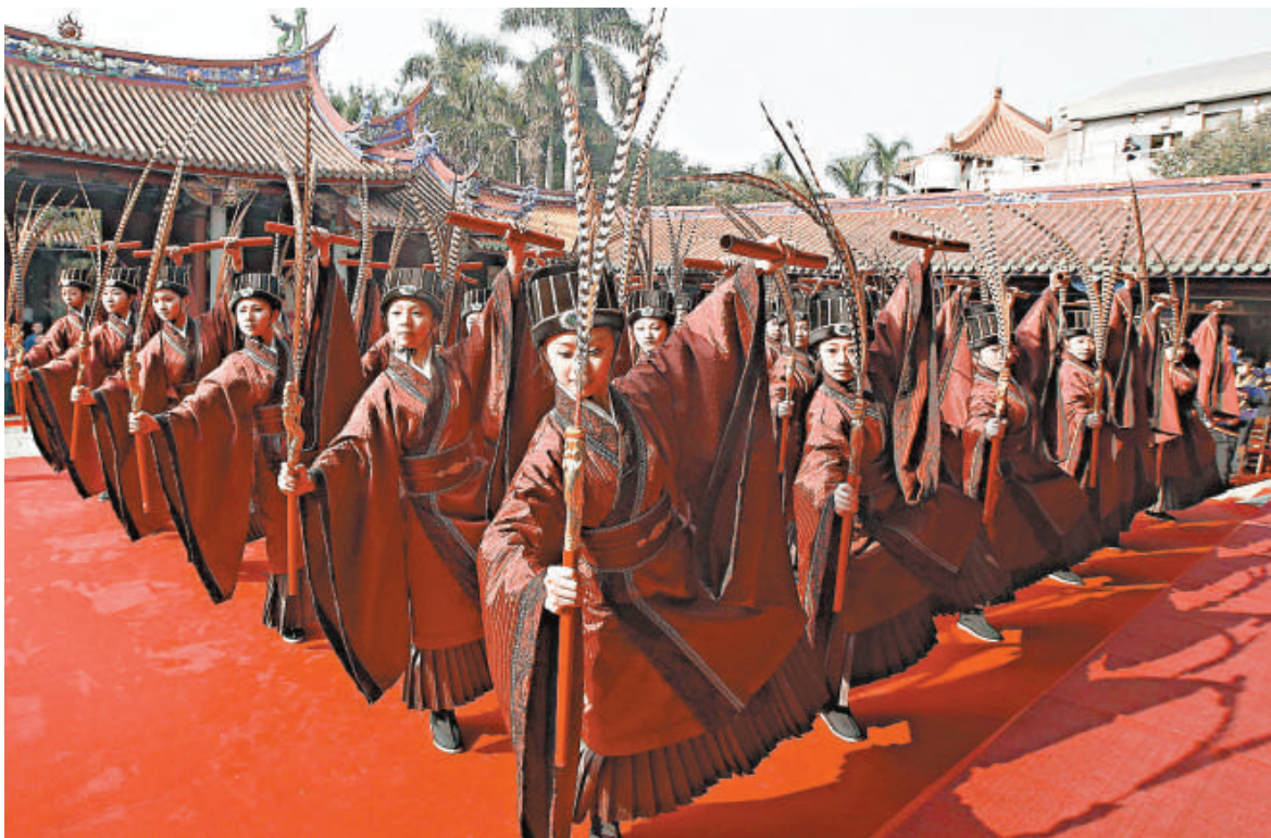
◀台北孔廟13日舉行春祭典禮，台灣藝術大學舞蹈系學生在大成殿前表演春祭新佾舞，在承襲傳統下，也加入現代元素，編舞理念主要為「和」，理現「圓融」理念。

作為中國第五大島與大陸距台灣本島最近的島縣，平潭開放開發首度被列入國家規劃綱要草案，正提請本次全國人大會議審議的「十二五」規劃綱要草案提出：發揮福建對台交流的獨特優勢，加快平潭綜合實驗區開放開發。