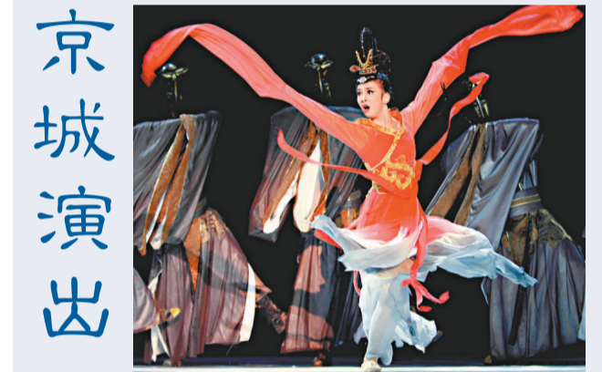
▲《水月洛神》承載了中原文化的舞蹈語言