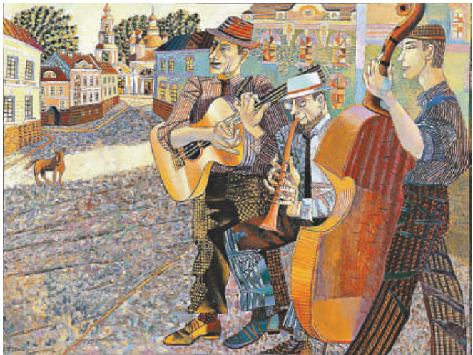
▲特什尼科娃作品《Old City Music》