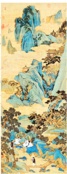
▲仇英《桃源仙境圖》複製品