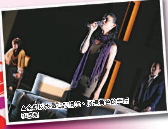
▲全劇以大量台詞憶述、展現角色的經歷和感受