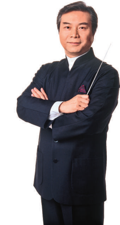
▲香港中樂團藝術總監兼首席指揮閻惠昌