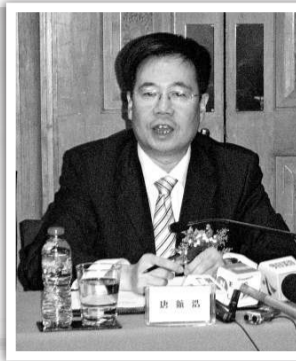
袁秀賢攝/設計圖片

在此次招商會上，荔灣共推出三類33個招商項目，其中舊城更新改造項目七個，總用地面積約64.28萬平方米。