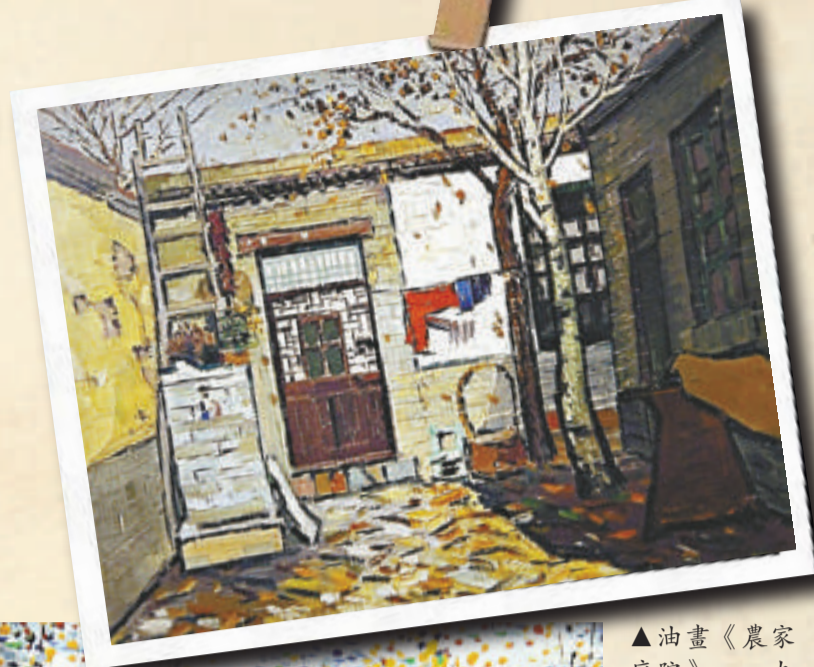
▲油畫《農家庭院》，一九八三年