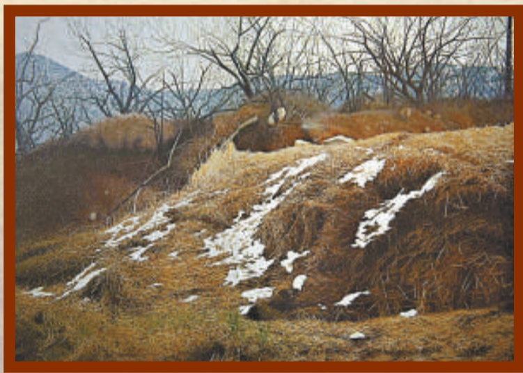
▲油畫《正月裡》，一九九九年