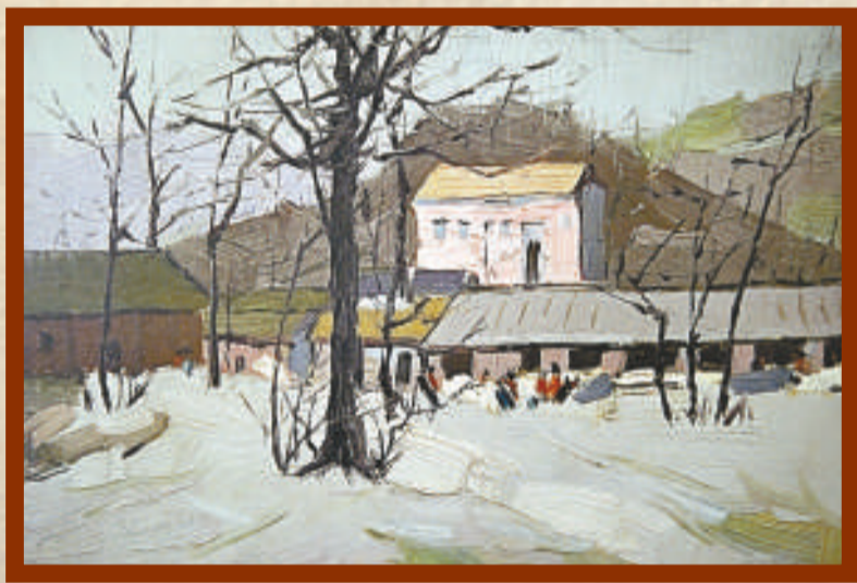
▲油畫《山腳下》，一九八四年