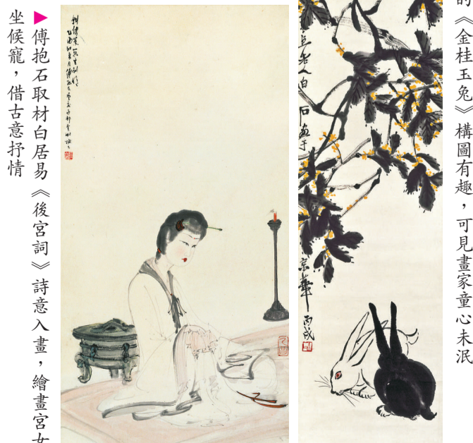
▲齊白石的《金桂玉兔》構圖有趣，可見畫家童心未泯 坐候龍，借古意抒情 傅抱石取材白居易《後宮詞》詩意入畫，繪畫宮女獨