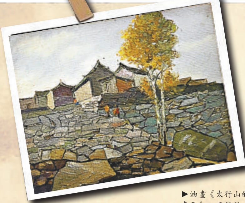
▲油畫《大石牆》，一九八三年