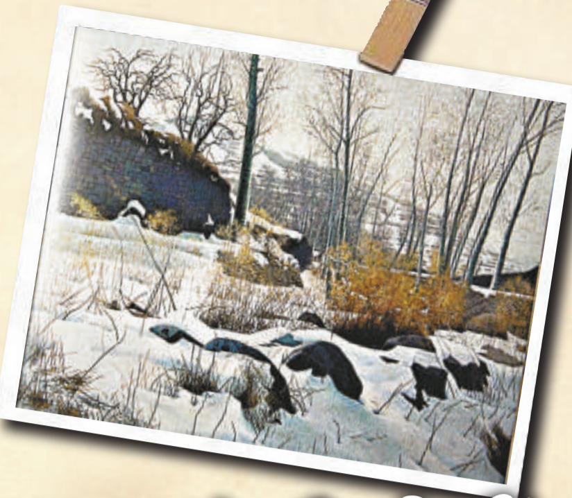
▶油畫《太行山的冬天》，二〇〇一年