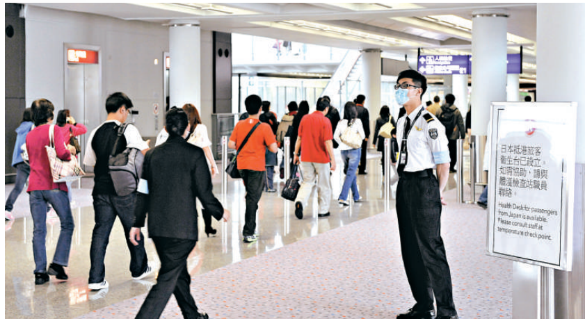
▲港府已在機場設立「日本抵港旅客衛生台」，並為旅客檢查體外的輻射水平