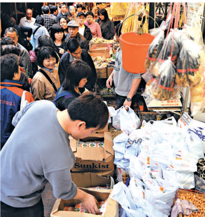
▲本港前日因輻射恐慌而出現市民盲目搶購食鹽情況，有精神科醫生指屬於集體性恐慌行爲