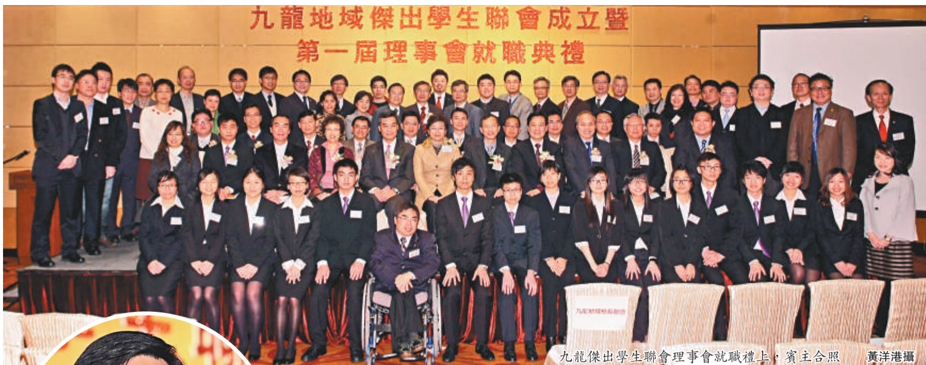
九龍地域傑出學生聯會成立暨第一屆理事會就職典禮