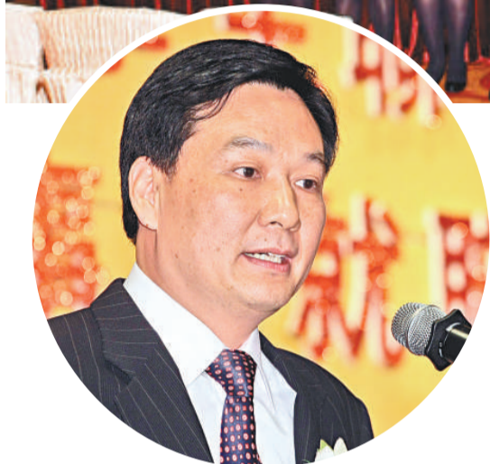
▲林武勉勵青年，要有理想和愛國情懷

「九龍地域傑出學生聯會成立暨第一屆理事會就職禮」於上週六在旺角帝京酒店宴會廳隆重舉行，超過二百名嘉賓出席。立法會主席曾鈺成、行政會議非官守議員召集人梁振英、中聯辦九龍工作部部長林武以及教育局副秘書長葉曾翠卿擔任主禮嘉賓。梁振英和林武分別作勉辭，勉勵各候任理事會成員等優秀年輕人在聯會創造的平台上團結一起，服務社會和貢獻社會。