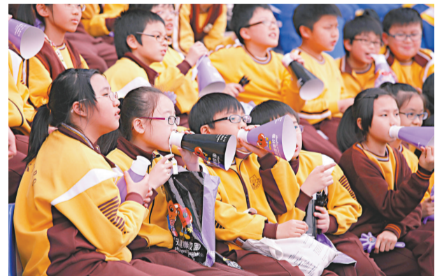
▲全港約有百分之五的小學生有不同程度的言語障礙

此外，根據教育局的網頁資料，該局將會為有溝通困難的學童，提供言語治療服務，以提高他們的學習能力及與別人溝通的技巧，避免語言發展成永久的學習障礙。特殊教育與輔導學系助理教授袁志彬表示，政府於〇九年撥款三千八百萬元推行「加強言語治療服務」，主要為學校提供額外津貼，讓學校可按校本需要，聘請言語治療師或外購校本言語治療服務，但整項款項只足夠聘請約七十名言語治療師，一名治療師或需要照顧多達二百多名學童。他估計，有百分之四出現不同程度言語問題的學童，未被發現或獲得適當治療。他說，語言學童若未能適當治療，將影響其學習，更會直接影響其日常社交，若不予以正視，可能造成成長障礙。