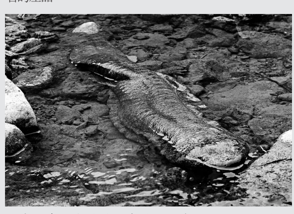
▲生活在張家界溪澗中的娃娃魚

【本報記者張思靜長沙二十二日電】記者今日從張家界市政府獲悉，張家界獨有野生保護動物大鯢（俗稱娃娃魚）已獲得國家地理標誌產品保護，而這也是我國第一個水生野生動物地理標誌產品。