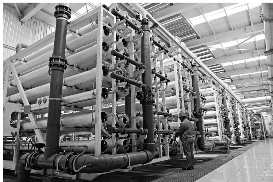
▲太鋼走低碳發展之路，打造「綠色鋼鐵」。圖為太鋼城市污水處理中心 新華社

【本報訊】中新社北京二十二日消息：中國社科院22日發布的《低碳經濟藍皮書》表示，中國發展低碳經濟面臨能源結構矛盾突出、產業集中度不高、外貿結構、人口規模擴大和人口結構變遷等四個壓力。