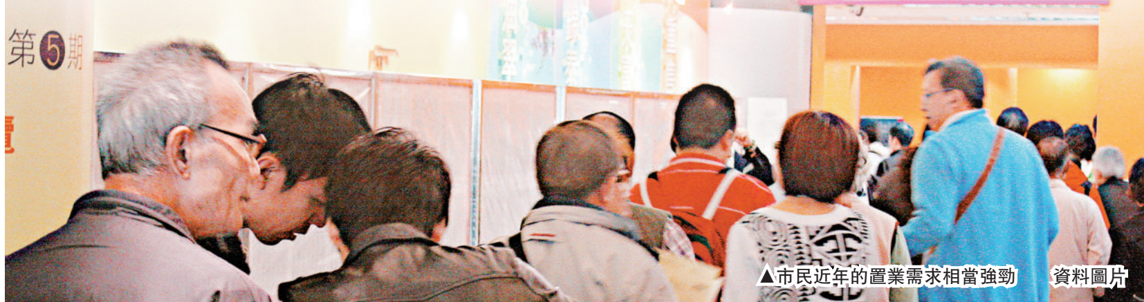
▲市民近年的置業需求相當強勁 資料圖片

為協助夾心階層上車，政府去年推出「置安心」計劃，在青衣、沙田、鑽石山、大埔、屯門等地區預留土地，並向房協提供有關土地，興建五千個實而不華的中小型單位，並以「先租後買」的方式供市民申請。鄭汝樺指出，「置安心」計劃可協助有供樓能力但欠首期的市民置業，當局正與房協研究加快進度，期望能於明年內接受市民預租申請。