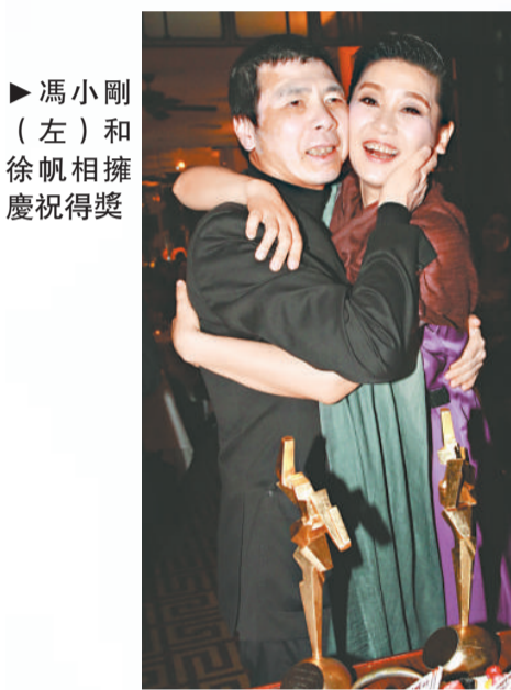
▶馮小剛（左）和徐帆相擁慶祝得獎