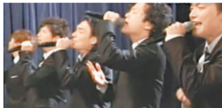
▲「SMAP」五子合唱首本名曲《世上唯一的花》

「SMAP」在地震後遲遲未有現身，惹來市民批評，而外界一直關心眾成員有否捐錢，製作節目的富士電視台表示，他們在地震發生後已分別捐款，同時亦全數捐出當晚節目的演出費。經過當晚節目後，「SMAP」即時挽回觀眾的好感，不少人讚他們留守東京主持節目，亦有人更大讚中居正廣，指他在節目中呼籲騙徒不要借震災詐騙的發言，甚有正義感。「SMAP」貴為國民級偶像，責任相對亦較重，相信他們今次現身，必定能為災民帶來鼓勵。