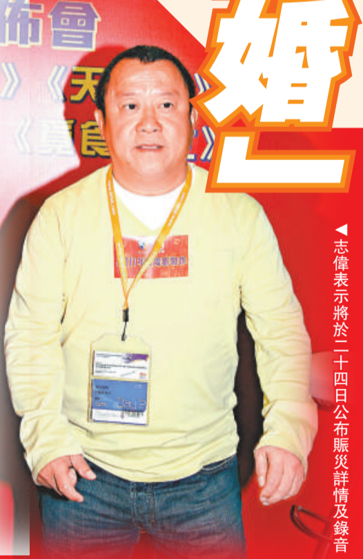
志偉表示將於二十四日公布賑災詳情及錄音

此外，即日開始，觀眾凡購買任何一張《我與妻子的1778個故事》(三月二十四日上映)及《海嘯3D：終極搶救》(四月七日上映)戲票，包括香港地區全線上映戲院的任何場次及任何票價戲票，影片發行商洲立及院商即會撥捐港幣二元至日本富士電影台賑災基金。