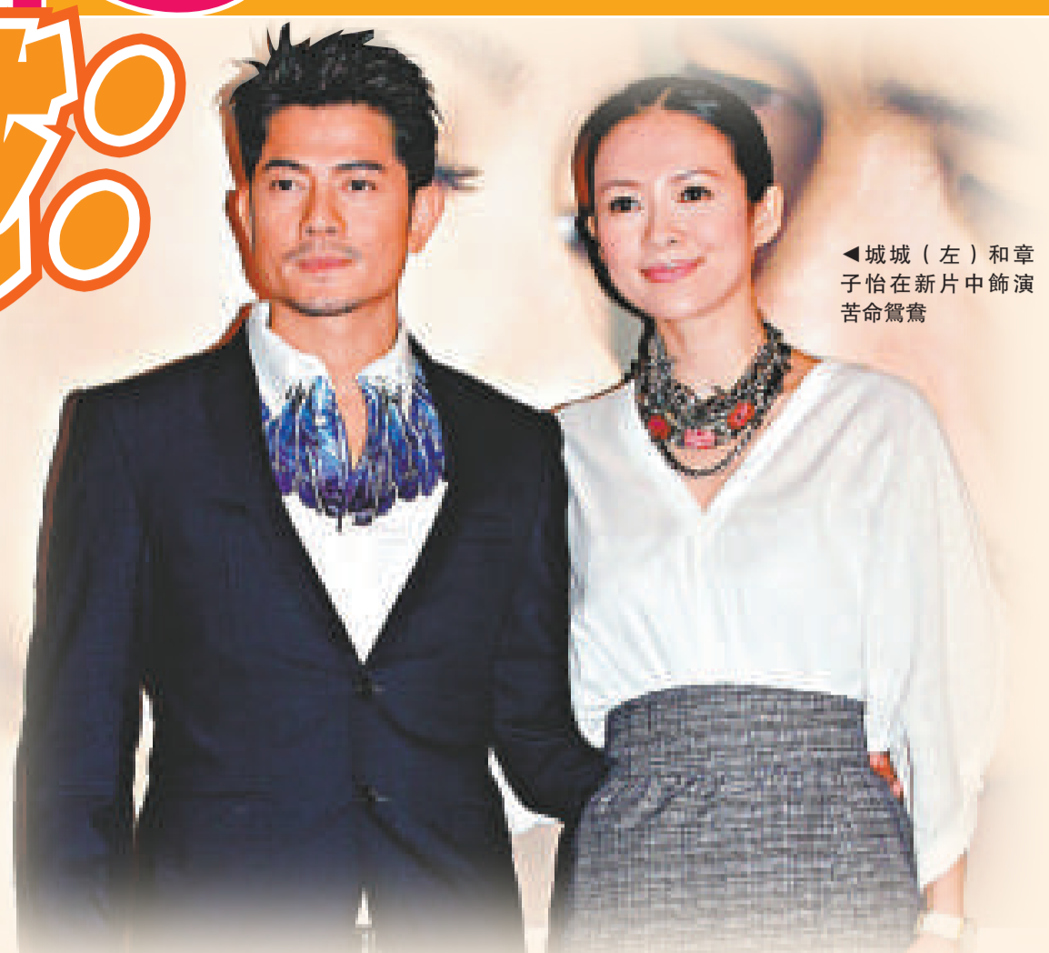
城城(左)和章子怡在新片中飾演苦命鴛鴦