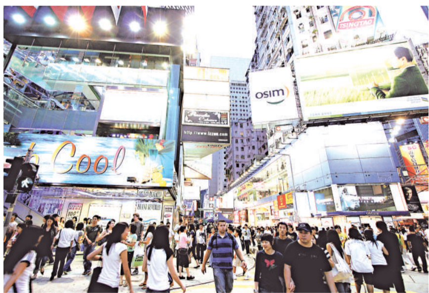
▲政府將推出指引減少光污染。圖為光污染甚嚴重的銅鑼灣

他解釋，由於本港樓宇密集，加上商住樓宇混雜，戶外的燈光難免影響附近的民居，而且立法亦會出現執法困難問題，若有民居同時受多種光污染滋擾，執法機構需要考慮法律的責任誰屬。