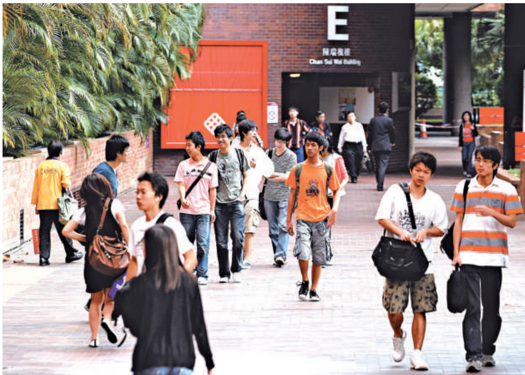
教育局可望今年第二季完成所有檢討學生貸款計劃報告資料圖片

另一方面，為配合明年舉行的中學文憑試，教育局及各持續教育院校已研究在一二／一三學年，推出新級進課程。教育局副秘書長李美嫦稱，當局為發展