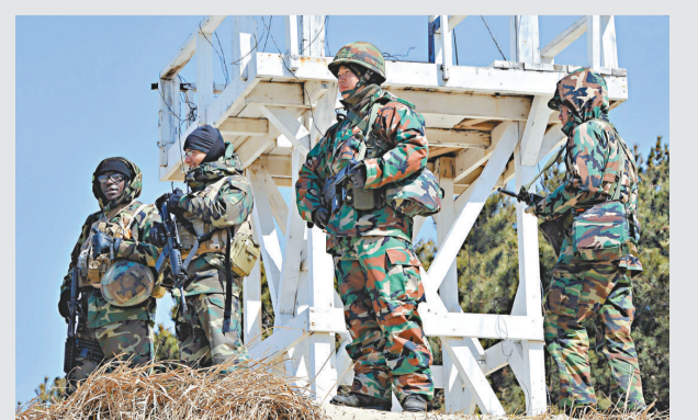
▲韓軍和美軍士兵23日參加聯合軍事演習

此次軍演由韓國軍方主導進行。韓方的5艘艦艇和美方的2艘艦艇參加演習。此外，韓方的16艘民間船隻也參加演習。另據韓國媒體援引政府人士的話報道說，韓國海軍將在「天安」號事件一周年之際，於本月25日至27日在韓國東、西、南部海域舉行大規模海上軍事演習。