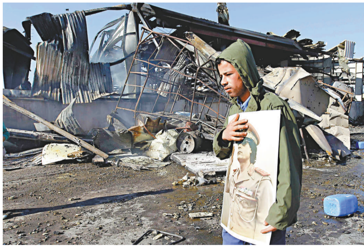
▲一名政府支持者22日手拿卡扎菲頭像經過首都被聯軍炸毀的軍事基地

【本報訊】綜合中新社、法新社23日報道：多國聯軍22日晚在利比亞進行第四輪空襲，該國領袖卡扎菲公開露面，指責空襲造成超過200個平民傷亡，重申會對抗到底。與此同時，美英法三國首腦在電話交談中同意北約在對利比亞軍事行動中起關鍵作用。